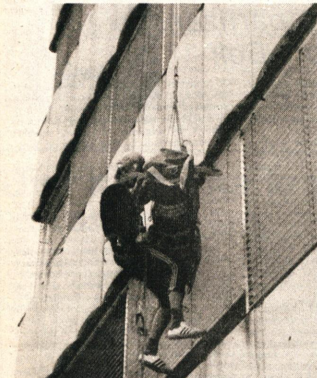
Jamarji pri reševanju ponesrečenca

Letošnja vaja enot CZ – ekip za prvo medicinsko pomoč s preizkusom znanja je potekala na bistveno drugačen način kot v preteklosti. Pri tej vaji so poleg ekip za PMP sodelovali še: jamarji, gorska reševalna služba, gasilci in vodniki z dresiranimi psi, ki naj bi pomagali iskati ponesrečence. Ekipa so se zbrale v soboto 21. maja v delovni organizaciji Svilanit. Sodelovalo je 22 ekip iz delovnih organizacij in krajevnih skupnosti.