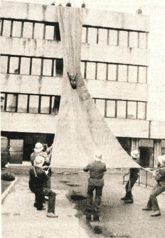
Reševanje iz upravne stavbe Svilanita