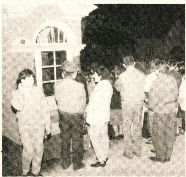
Pred kapelico ali za njo, privlačnost gibanja je čutiti povsod