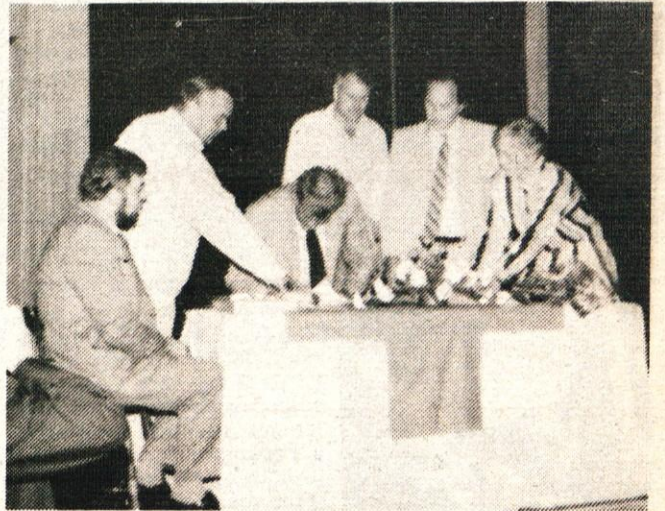
Podpis listine o pobratenju