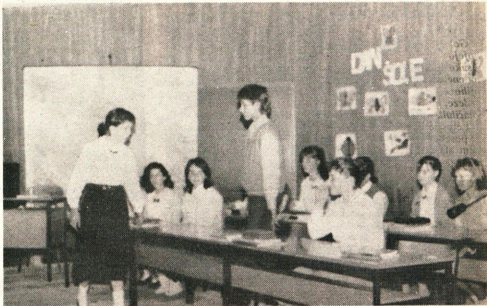
SVOJE SO DODALI K PRAZNIKU TUDI ČLANI DRAMSKEGA KROŽKA