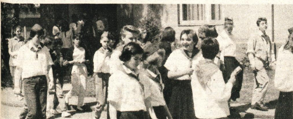
V petek, 3. junija, so TITAN obiskali pionirji iz Beograda. V Kamniku so se ustavili v okviru akcije »Po Titovi poti«. Pionirje so sprejeli predstavniki družbenopolitičnih organizacij. V lepem vremenu in prijetnem razpoloženju so si ogledali delovno organizacijo in muzej, v katerem je prikazana razvojna pot TITANA.