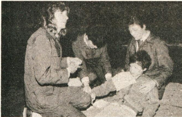
Prva pomoč ponesrečenemu