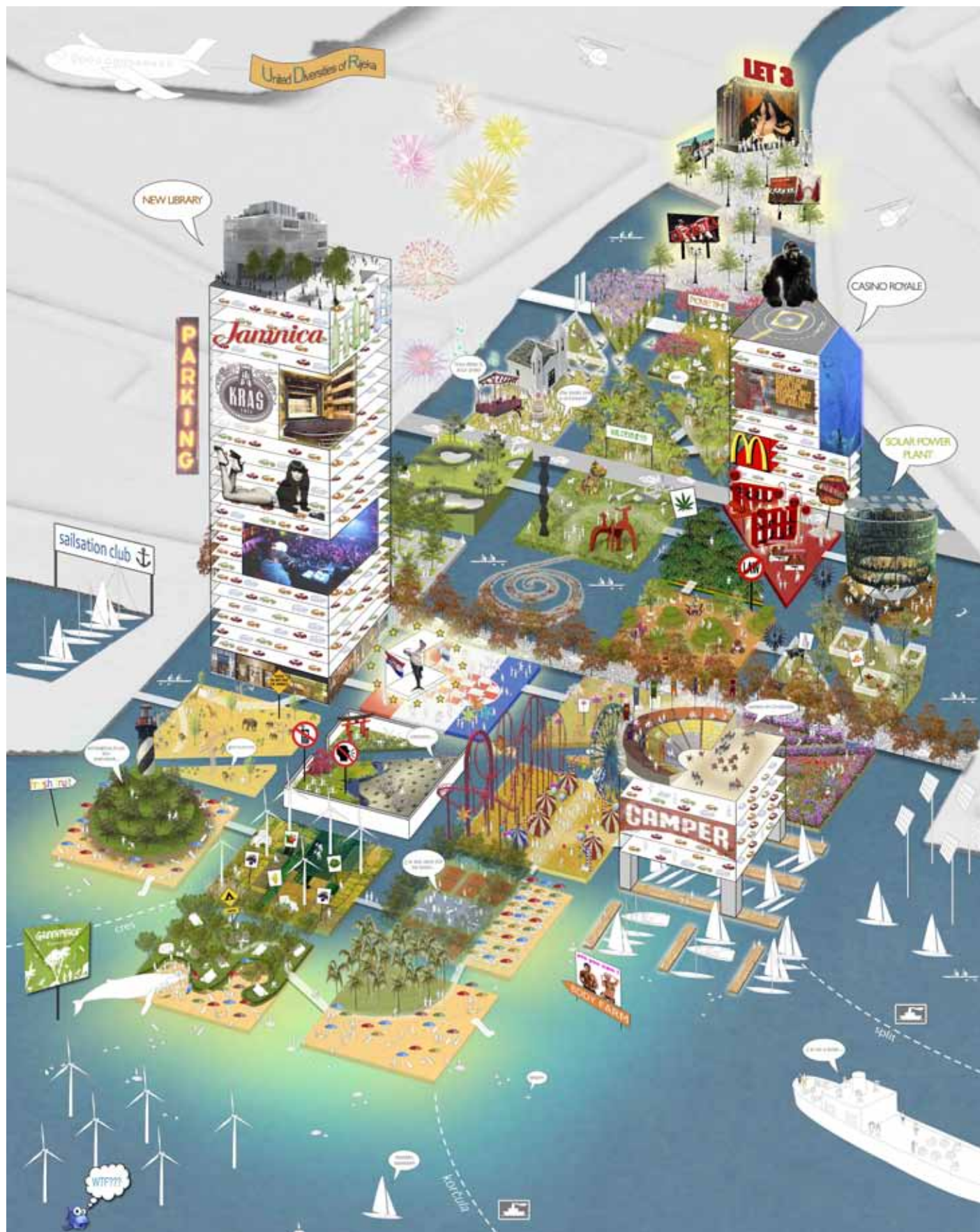
Slika 3: Otočje skoraj neomejenih možnosti, kot priložnost za mesto.