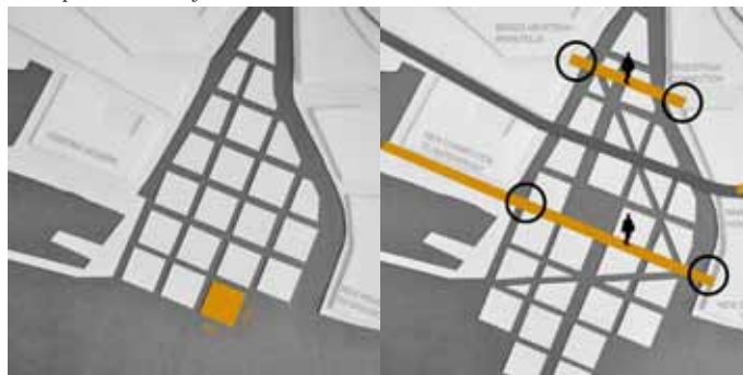
Slika 2: Levo: Območje obdelave na pravokotno mrežo razdeli sistem vodnih kanalov. Desno: Obstoječe poti in značilnosti dajejo karakter sicer enotni prostorski mreži kanalov.