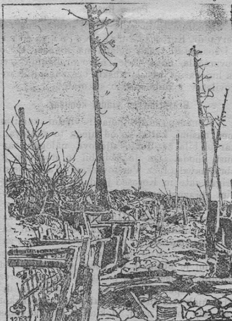
Van Westen: Das Gelände nach dem Kampf. način je vojni hrup upostočil na enak način skoraj vsa bojna polja.

Predstoječa slika nam kaže ozemlje na Francoskem bojišču po bitki. Na neverjetni