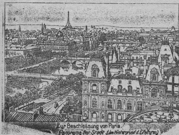
Zur Beschüssung von Paris Panorama der Stadt (im Hintergrunde d. Eiffelturm)

Kakor je iz uradnih poročil že znano, obstreljujejo Nemci Pariz z kanoni, katerih granate prihajajo iz daljave 120 kilometrov, kar je povzročilo ne le samo med Francozi in Angleži, ampak tudi na celem svetu, veliko presečenjenje. Prinašamo torej sliko tem obstreljevanju izpostavljene francoske prestolice in upamo, da se bode tem francoskim vojno-pijanem hujšakcem pri teh streljih pamet razvedrila. V ozadju slike vidimo svetovnoznani Eifel-stolp