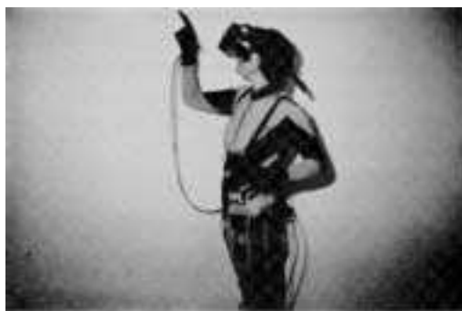
ilustracija iz knjige VIRTUELE WELTEN

Nekje na začetku stoletja se je Douglasu C. Engelbartu posvetilo: če bi lahko uporabljali moč računalnikov za mehanični del mišljenja in če bi lahko z računalnikom delili naše ideje, bi imeli ljudje več možnosti za skupno premišljanje težjih problemov in s tem za njihovo razrešitev.