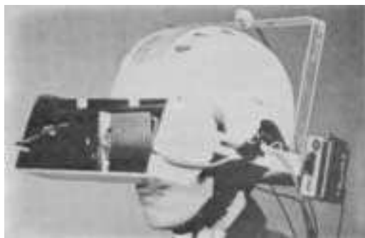
ilustracija iz knjige VIRTUELE WELTEN

BODY LANGUAGE vsebuje video kamere, računalnike, sintesajzerje, digitalne mikserje, ki transformirajo človeške gibe v zvoke in slike, s tem ustvarja sintetično resničnost, ki jo je moč telesno raziskati.