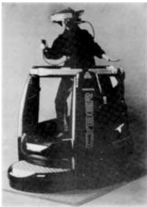
ilustracija iz knjige MONDO 2000

Tjaša Demšar , študentka avdiovizualne umetnosti na Akademiji v Groningenu (Nizozemska). Ustvarja na področju slikarstva, fotografije, računalniške grafike in videa.