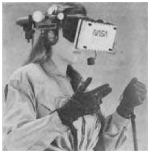
ilustracija iz knjige VIRTUELE WELTEN