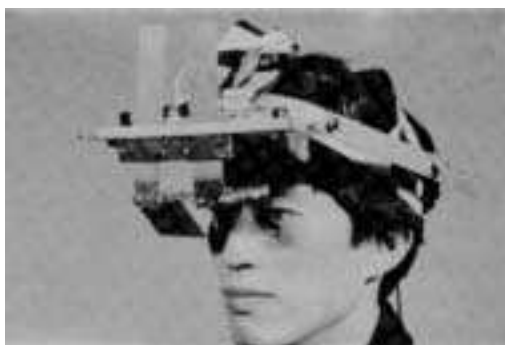
ilustracija iz knjige VIRTUELE WELTEN

Za ta projekt ni uporabil računalniške grafike, ampak druge tehnologije. Skrite mini računalnike, zvočne sintetizatorje, mrežo cevi, napolnjenih s fosforescentnimi barvnimi tekočinami. Temen prostor se je tako spremenil v nekaj, česar do tedaj še nihče ni videl. Vseboval je zvok-svetlobo, ki sta bila prilagojena človeški pozornosti in obnašanju. Odgovor občinstva na to okolje je bil precej zanimiv. Med seboj tuji ljudje so se povsem spontano združevali, se igrali, ploskali, peli. Na trenutke smrtna tišina, nekateri ljudje so postali vodiči drugim, neka ženska je pri vходу poljubljala vsakega moškega, ki je vstopil... Za večino ljudi je bil ta prostor močna izkušnja in mnogim se je dozdevalo, da jim je prostor odgovoril, na načine, ki so bili za obstoječi prostor docela nemogoči.