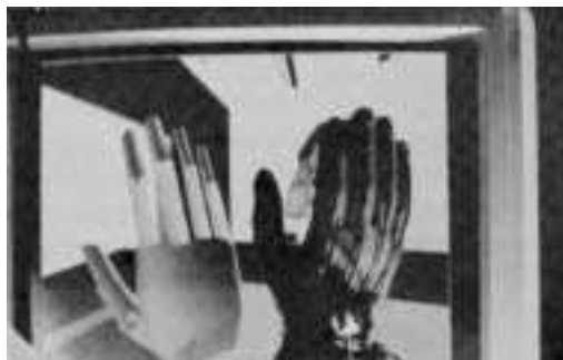
ilustracija iz knjige VIRTUELE WELTEN

Ustanovljen je bil leta 1989. Denar zanj prispeva več kot 140 družb.