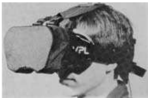
ilustracija iz knjige VIRTUELE WELTEN