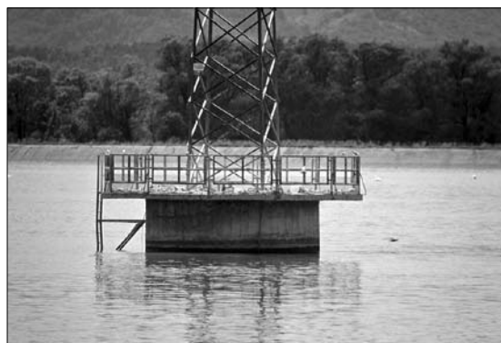
Slika 1: Betonski daljnovodni podstavek na Ptujskem jezeru, kjer je bila leta 2004 kolonija navadnih čiger Sterna hirundo

Ptujsko akumulacijsko jezero je nastalo z zajezitvijo reke Drave v Markovcih pri Ptuj. Zgrajeno je bilo za potrebe delovanja pretočne kanalske hidroelektrarne Formin, ki je začela obratovati leta 1978 (ŠMON 2000). Površina jezera je 4,2 km 2 . Nasipi jezera so umetni. Območje sodi v subpanonsko zoogeografsko regijo Slovenije (MRŠIČ 1997) in je del posebnega