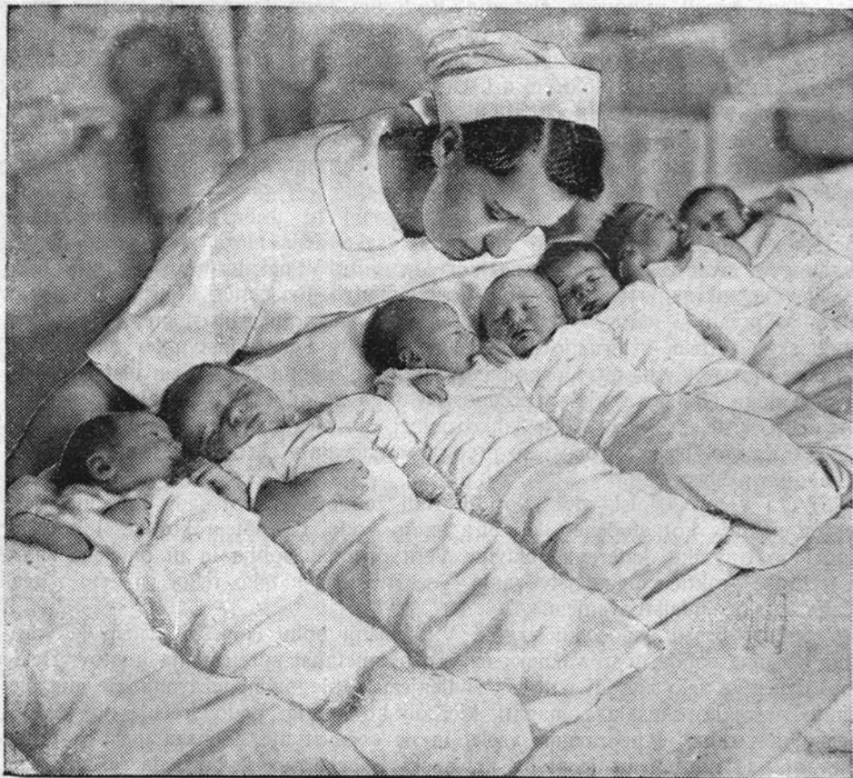
Skrbstvena (zaščitna) sestra pri ponočni službi.

Bog se je milostno name ozrl — videl je v srce moje trpeče: rajska vrata je širom odprl ... Žgoči bolesti me blago je skril: vso me je z zlato zarjo obli.