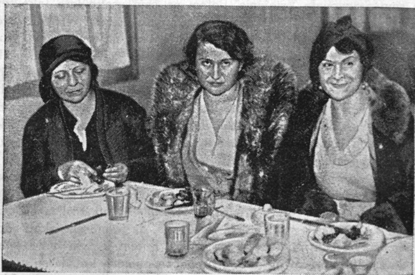
Edine tri ženske, ki so se rešile iz nedavno popolnoma zgorelega francoskega luksusnega parnika »Atlantique«.

Gospod je svoji zvesti nevesti gotovo že obilno poplačal; nam pa, ki smo jo poznale, bo vedno vzor veleizobražene žene in vzorne redovnice.