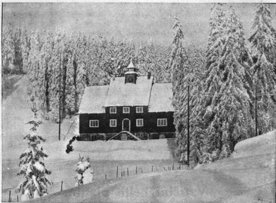
Zimska idila v gozdu.

Pa se je oglasila v tiho noč pesem in odmevala tja v sanjajoče vasi, ki so snivale daleč pod nami in so šli zvoki do belih, snežnih vrhov.