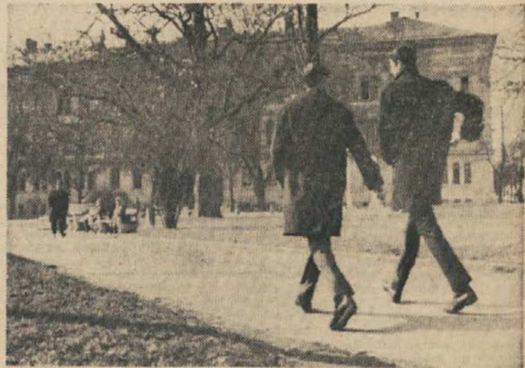
Vsakdanja pot v gimnazijo — zaman?

Spregledali pa smo še eno bistveno stvar. To je latinščina. Latinščina je bodočemu intelektualcu nenadomestljiva izobrazbena osnova. Tega se