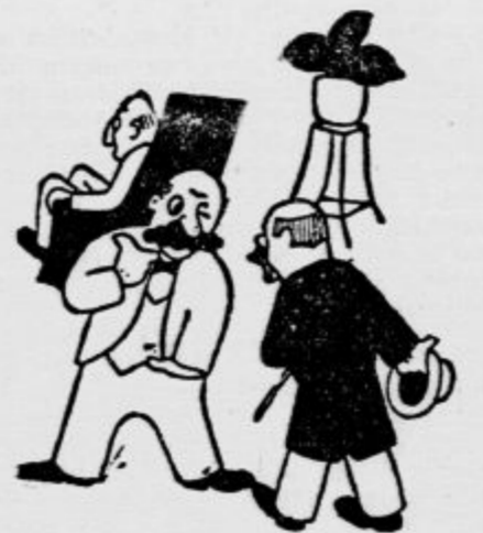
»Moj stari oče ne razume šale.« »Ali je tako zagrenjen?« »Ne, ne — gluh.«

Na Janonskem se pripravljajo sedaj na proslavo nenavadnega praznika, kakršen je mogoče pač samo na Japonskem, v klasični deželi cvetličnega in rastlinskega kulta. Obhajali bodo 1300-letnico rojstva velikanske smreke ki igra v japonski mitologiji in zgodovini valno vlogo. Zasadil jo je l. 629. v mestu Karasakiju cesar Jonej ob svojem ustoličenju na čast boginji Vakamasahimi. Še dandanes romajo velike množice pobožnih Japoncev k častitljivemu drevesu, ki meri v obsegu 12 in v višino 80 m.