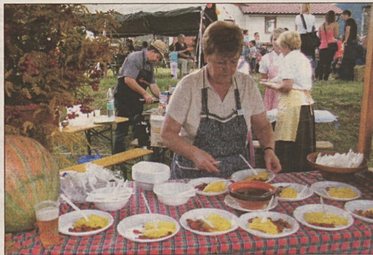
Na stojnici društva iz Kosez je dišala polenta z ocvirki

Skupina Zeljena gasa iz Dolnjega Zemona je pripravila okusen ječmen, njihovi prvi sosedi na prireditvi, lovci iz Zemonske družine lovski golaž, bistriški ribiči marinado, zemonsko društvo pa kumpir na zevnici in palačinke. Pregarci so postregli gobe s polento, Koseščani, Društvo podeželjskih žena in Topol-