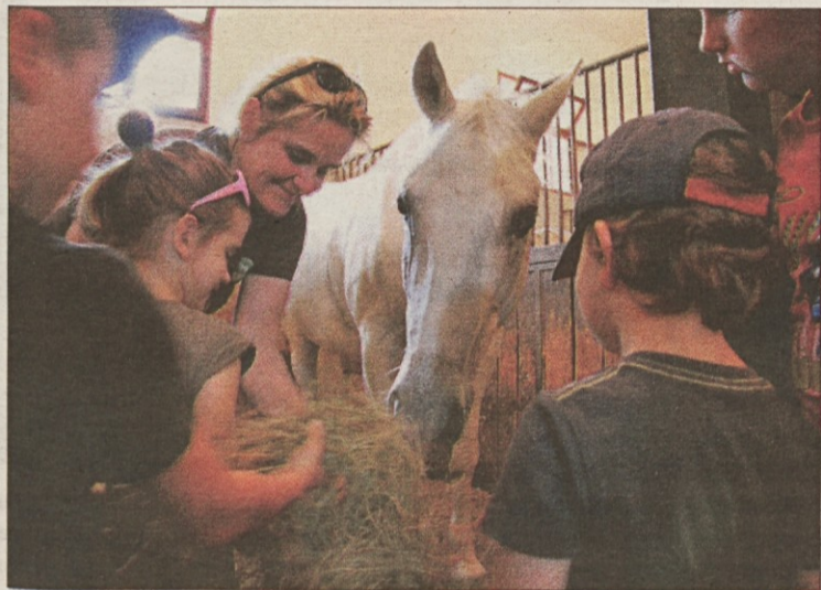
Dan Kobilarne Lipica vabi tudi z bogatim programom za družine in otroke.

Vsem, ki želijo spoznati konje ter izvedeti, kako ko-