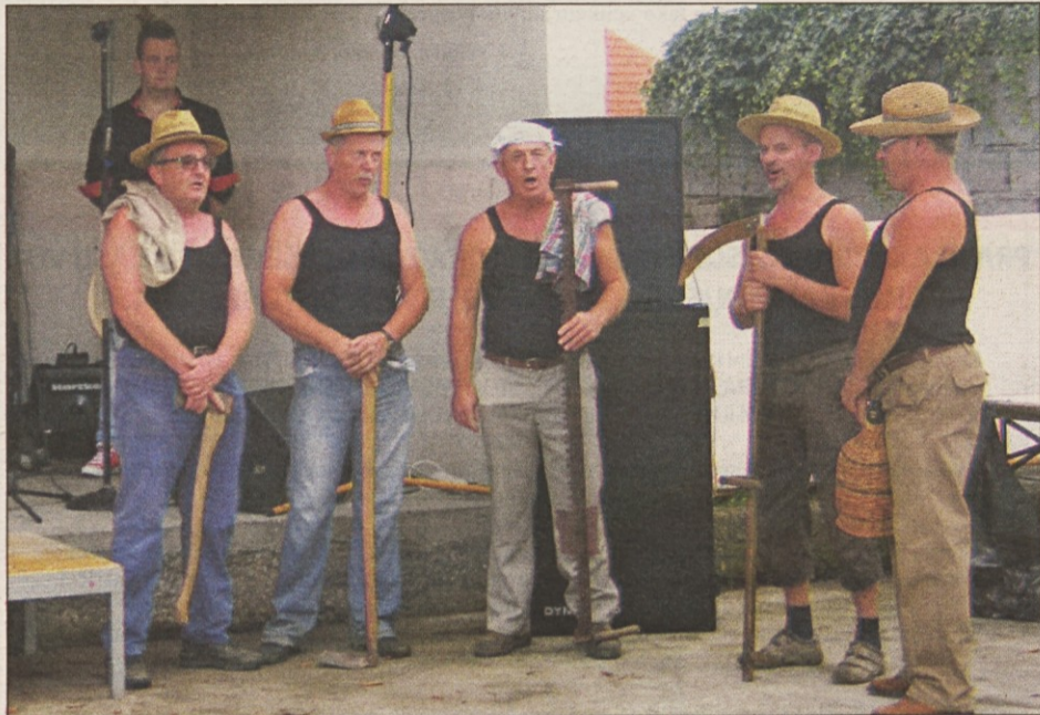
Vedno bolj ubrani Zemonski fantje so ponovno navdušili s pristnim ljudskim petjem