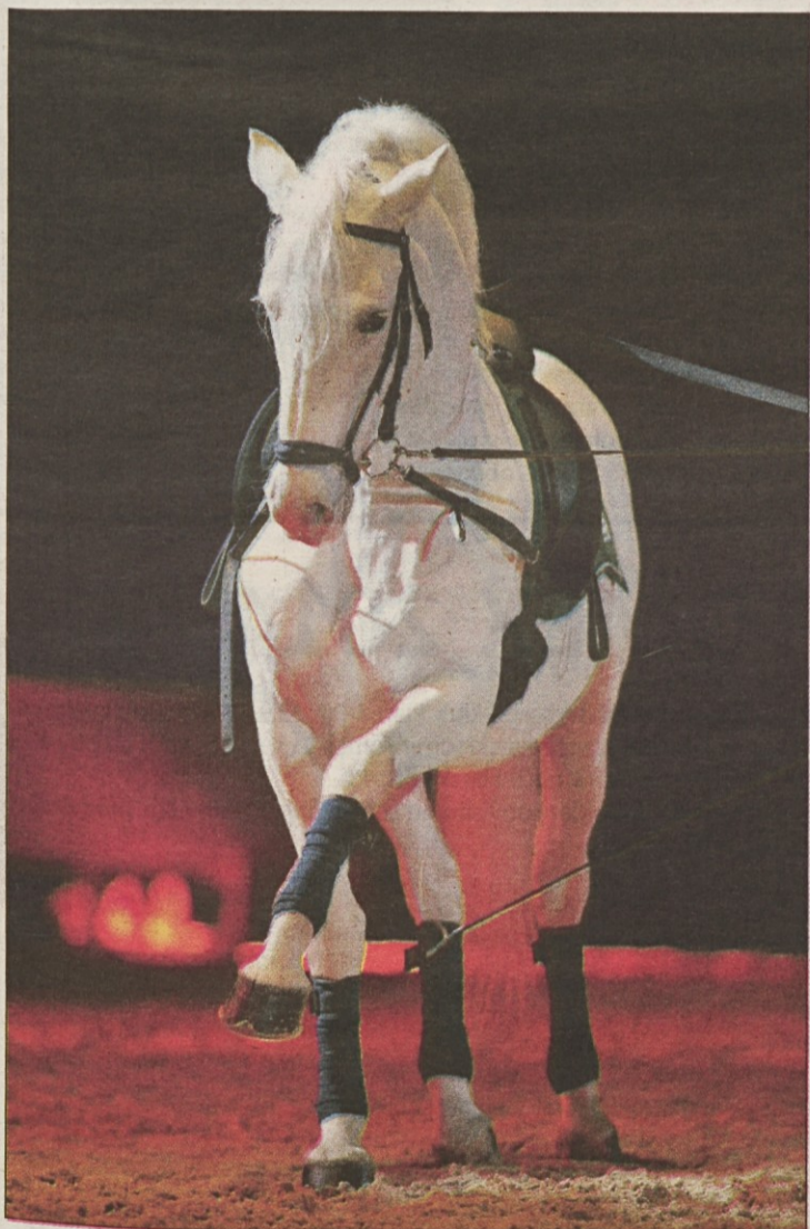
Lipicanski žrebci vedno znova navdušijo s svojo lepoto in temperamentom!

Španije, natančneje iz Andaluzije. S temperamentnimi andaluzijskimi žrebci, ki so