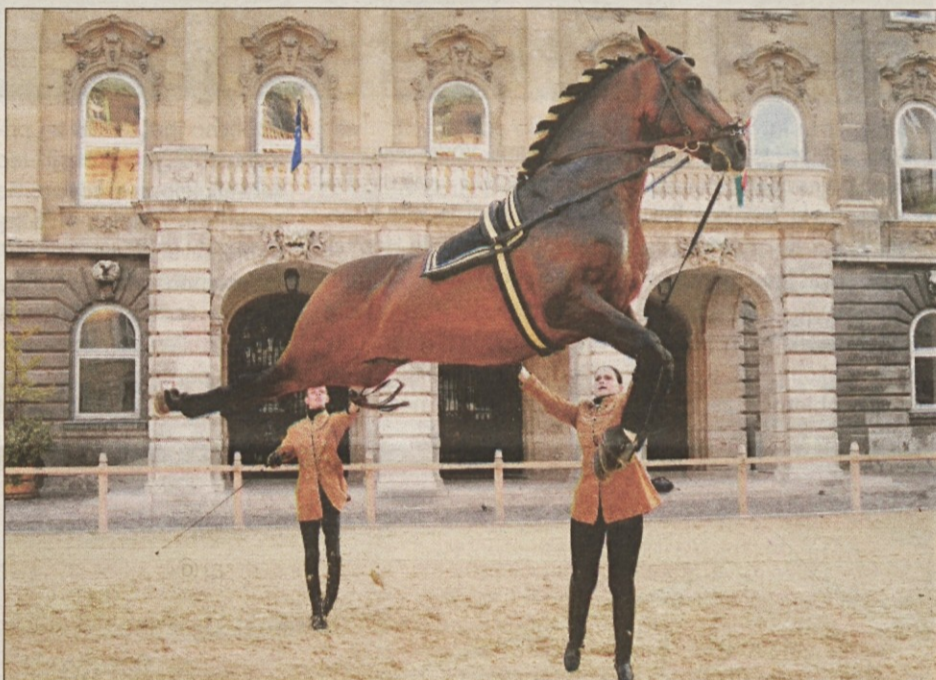
Gostje gala predstave bodo člani jahalne šole EPONA s temperamentnimi andaluzijskimi žrebci.

nji vidijo, slišijo in se spoznavajo med sabo, bo na Dnevu Kobilarne Lipica namenjen program Kdo je konj?. Najmlajši otroci bodo