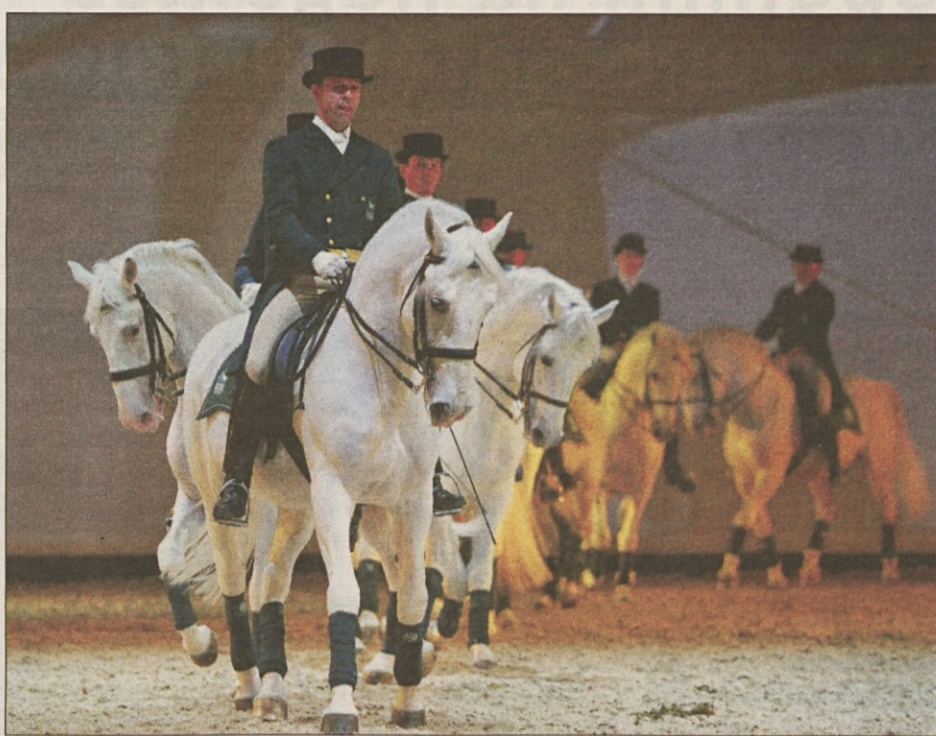
Lipiška klasična šola jahanja se bo predstavila z izbranimi lipicanskimi žrebci.

pred stoletji pomembno prispevali k oblikovanju lipicanske pasme, se bo predstavil konjeniški center EPONA, saj prav tako kot Kobilarna Lipica neguje klasično dresurno