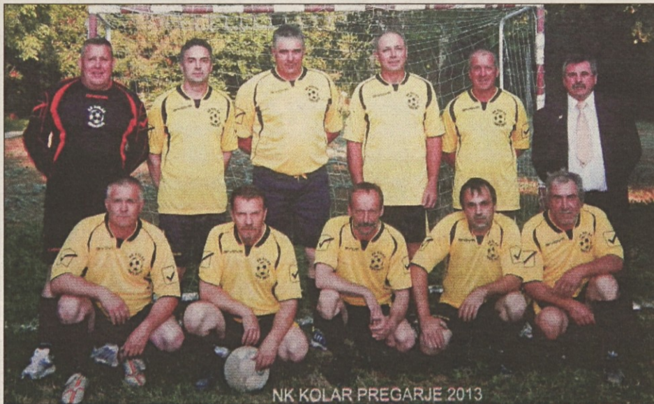
NK KOLAR PREGARJE 2013

na Pregarjah. Na turnirju je bil razstavljen pano, kjer so bili prikazani dosežki ekipe Kolar (pokali in priznanja) in zgodovina nogometa na Pregarjah. Na koncu turnirja so jih presenetile žene s torto, na kateri je bilo upo-