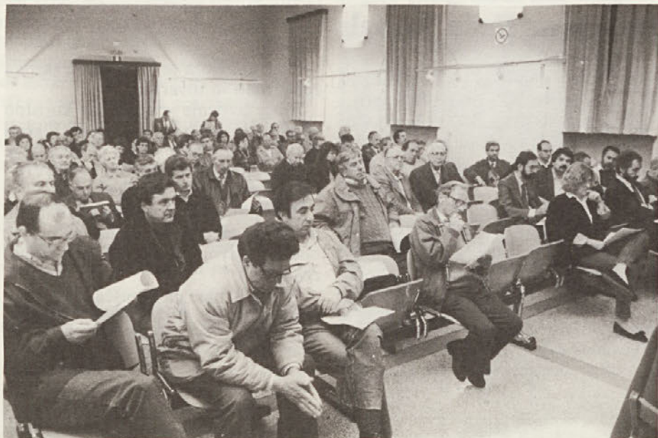
Pogled na udeležence srečanja o vprašanjih kraškega dela tržaške občine, ki so ga priredile krajevne sekcije KPI 7.4.1989.

Pri utemeljitvi svojega odklonilnega glasu je KPI napovedala odločno a konstruktivno opozicijo, zato da obrzda škodo, ki jo zdajšnja uprava prizadeva krajevni skupnosti.