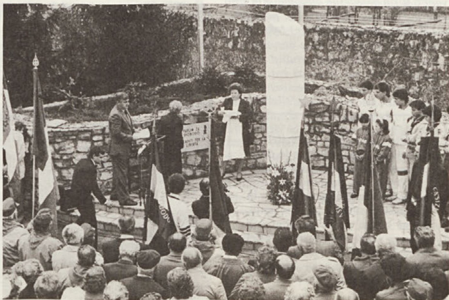
V nedeljo, 9. t.m. so v Rupi na Goriškem odkrili spomenik padlim za svobodo.

Človeku zmanjka besed, ko se mora posloviti od takšnega tovariša.