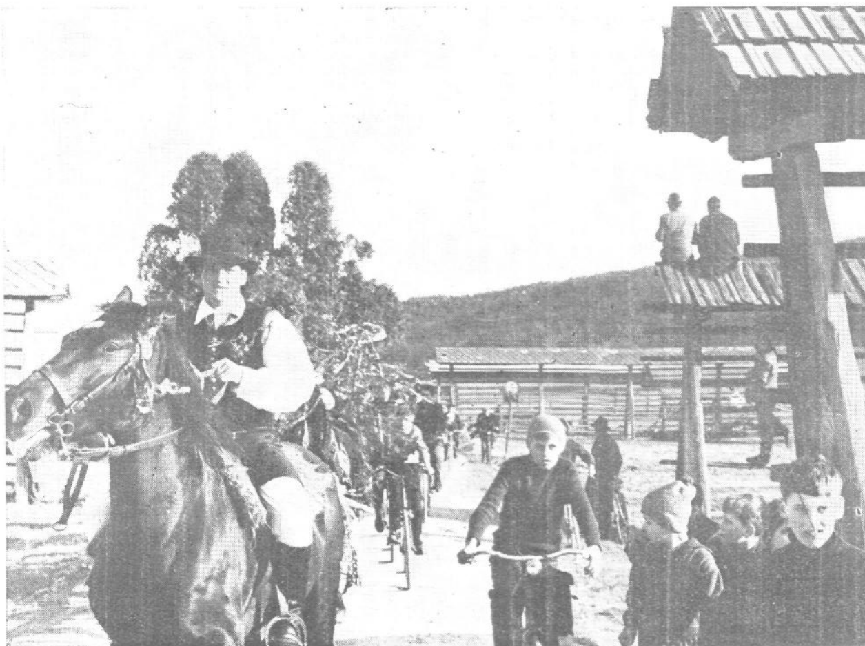
Za začetek turistične sezone „Kmečka ohcet“