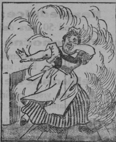
Ko vendar enkrat zagori, po kuhinji se zakadi.