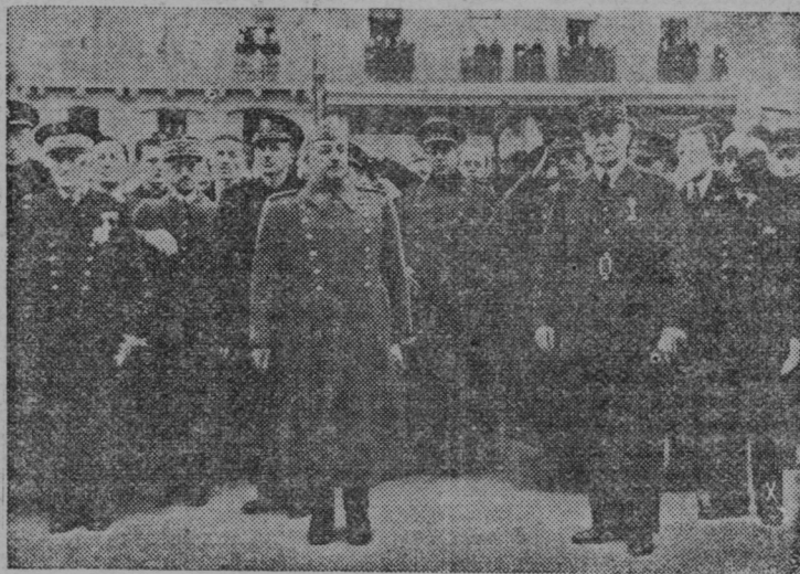
Sestanek generala Franca s francoskim maršalom Petainom

Otok Fernando Poo leži na severni strani ravnika nasproti Kamerunu. Ima 22.000 prebivalcev. Podnebje je zelo nezdravo. Otok je važen zaradi pridobivanja kavčuka. Na obdelanem koncu otoka pridelujejo tudi kavo, riž, kakao, banane, sladkorni trs, palmo, ki daje olje in tobak. To je najbogatejša španska posest. Na tem otoku je tudi sedež španskega guvernerja, ki upravlja prej omenjeno Gvinejo in otok Annobon. Otok je dobil ime po Portugizu Fernandu Pooju, ki ga je odkril. Annobon je otok majhne vrednosti in majhnega pomena. Annobon znači srečno leto in prihaja odtod, ker so ga odkrili na novega leta dan 1471.