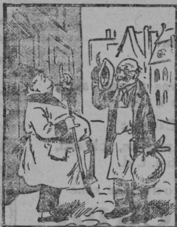
»Tu pušča streha nad menoj.«