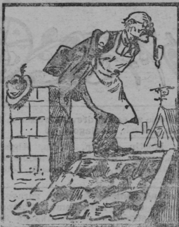
Že mož na slemenu čepi in svojo pipico kadi.