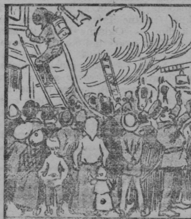
Požarna bramba že gasi, kot pekel hiša se kadi.