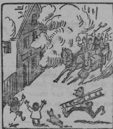
So mislili, da je požar, ljudje so prišli kot vihar.