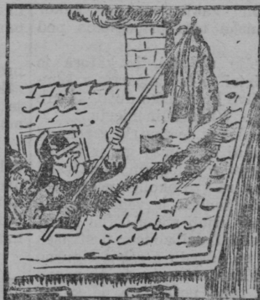
Naenkrat ognjegasec star je našel tisto strašno stvar, ki dvignila je tolik prah in naredila še večji strah.