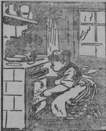
Prižiga Micka svojo peč, goreti noče, čudna reč!