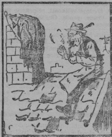
Pa slekel suknjo je nato, pogrnil ves je dimnik ž njo.