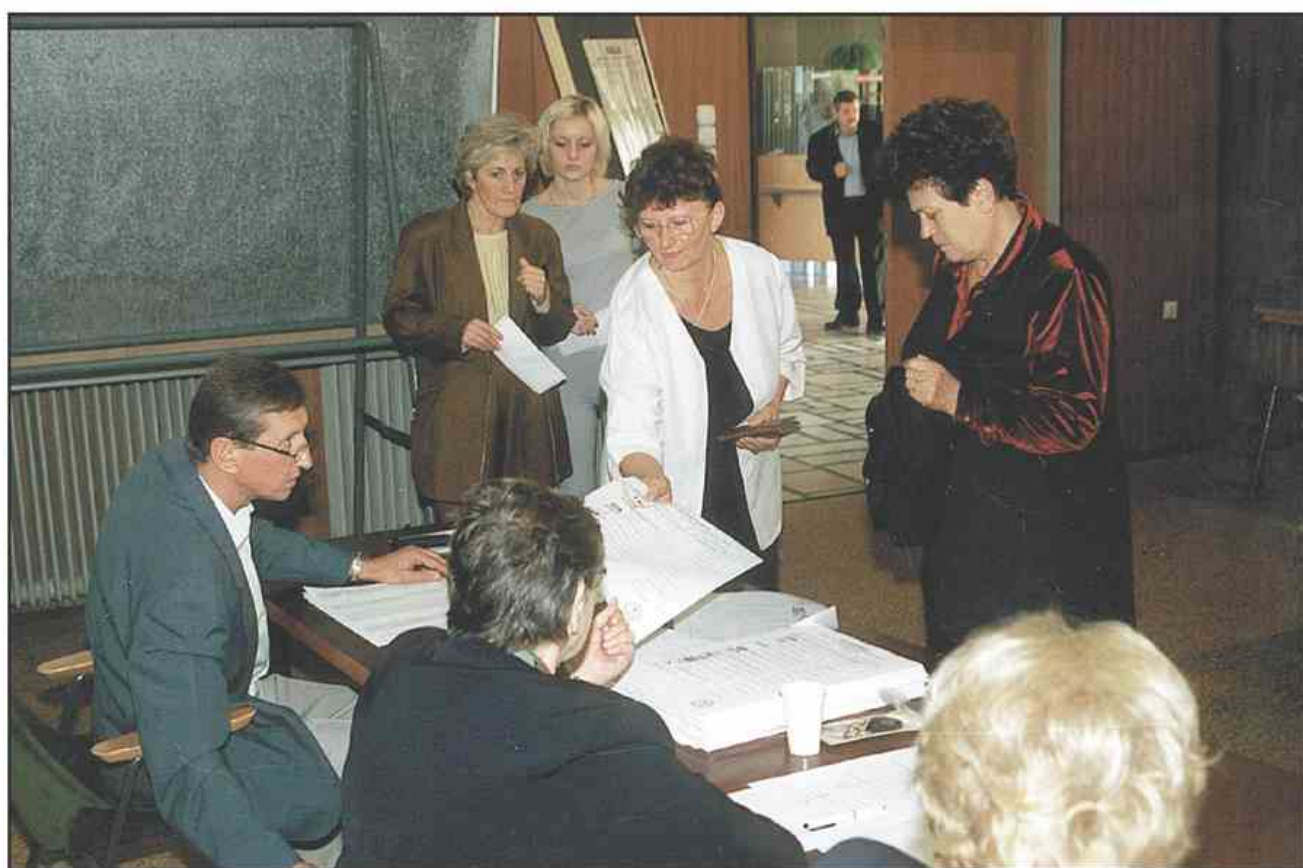
Volilna udeležba na nedeljskih parlamentarnih volitvah, je bila v Šaleški dolini sicer nekoliko slabša kot pred štirimi leti, vseeno pa zelo dobra. (Stran 4)