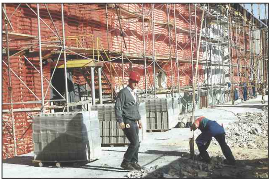
Gradnja nave Galvane Gorenja je že stekla. Izvajalci obljublajo, da bo do 22. novembra pod streho.

Med delavci se je razširila informacija, da nekaterih sestavnih delov, ki jih zdaj izdelujejo vaši kooperanti, ne nameravate ponovno vključiti v svojo proizvod-