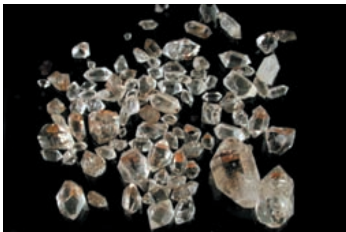
Cerkniški kremenec iz Zoisove zbirke, veliki do 1 cm, so lahko pravilnih oblik in brez vključkov. Zato so jih nekoč imenovali cercniški diamanti.