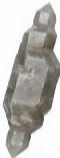
Kristal kremen s Slivnice; 49 x 13 mm. Najdba in zbirka Rafaela Šerjaka.

ŽORŽ, M., A. REČNIK, 1998: Kremen in njegovi pojavi na Slovenskem (morfologija kremenov iz okolice Cerknice, str. 51-52). Galerija Avsenik, Begunje.