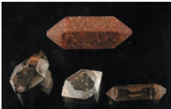
Čadav in brezbarven kremen ter kremen z rdečkastimi vključki iz okolice Grahovega pri Cerknici; največji je dolg 1 cm. Najdba in zbirka Davorina Preisingerja.

razlik v morfologiji, kristalnih ploskvah in barvnih odtenkih. Edino, česar nismo zasledili pri novjših najdbah, so pentljusti kristali z razcepljenimi terminacijami. Po vsej verjetnosti so tisti iz Zoisove zbirke z danes nepoznane mikrolokacije.