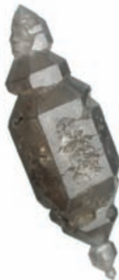
Kristal kremenca s Slivnice; 29 x 8 mm. Najdba in zbirka Rafaela Šerjaka.

V enih in v drugih je veliko vključkov ogljikovodikov. Kristali kremenca iz Zoisove zbirke so praviloma idiomorfno razviti. Biterminirani kristali so največkrat dolgoprizmatški, le v posameznih primerih je prizma zelo kratka ali pa je celo ni. Prosojni kristali so v povprečju veliki okoli 15 mm, največji pa so motni