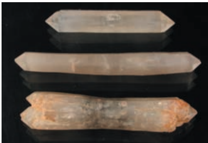
Dolgoprizmatški in pentljasti kristali kremen iz Zoisove zbirke; najdaljši 18 mm.

in merijo do 4 cm v dolžino ter do 1 cm v premeru. Ploskve prizem so motne, ploskve na terminacijah pa nekoliko vbočene in v posameznih primerih skeletno razvite. Pri nekaterih kristalih so terminacije divergentno razcepljene v šest subindividuomov. Taki kristali so na sredini prizemskega pasu tudi mnogo ožji, zaradi česar imajo izrazito pentljasto obliko. To je pri kremenу nasploh izredno redka morfologija. V zbirki je nekaj žezlastih kristalov, dokaj pogosti pa so tudi čadavi. Nekateri kristali iz zbirke imajo mehansko zaobljene robove, kar kaže na transport iz matične lege v sekundarno ležišče.