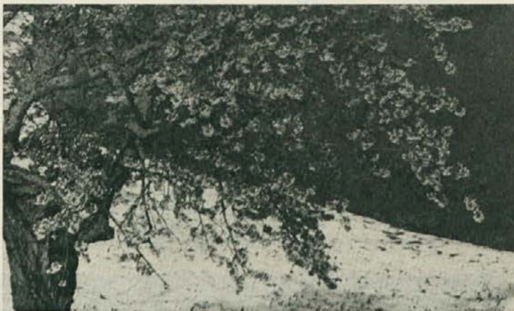
Češnja cveti v snegu