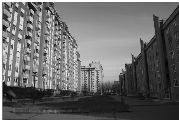
Slika 3: Bratovševa ploščad

Savljje, Kleče in Stožice so tisti deli tega območja, ki so zaradi odmaknjenosti od glavnih vpadnic najbolj ohranili elemente ruralnega. Območje Savelj lahko glede na fizični videz razde-