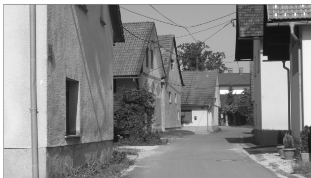
Slika 4: Stari del Savelj

limo na dva dela. Novi del se nahaja med železniško progo in Saveljsko cesto. Zanj je značilna povojna gradnja individualnih hiš, ki je povzročila nastanek novih ulic za glavno cesto. Drugi del Savelj pomeni stari vaški del naselja, ki ga zaznamuje obcestna vaška arhitektura z nekaterimi še danes delujočimi kmetijami. Poselitve v Klečah je strnjena ob glavni cesti in se ni širila v prostor z novimi ulicami. Elemente ruralnega lahko najdemo tudi v obstoju hišnih imen, Kmečki strojni skupnosti Savlje Kleče (strojna kmetijska zadruga za Savlje in Kleče je bila ustanovljena leta 1907) in Kulturno prosvetnem društvu Savlje Kleče, ki skrbi za vsakoletno organizacijo folklorne prireditve štehvanja. Ježica in Mala vas sta od vseh nekdanjih vasi najbolj urbanizirani oziroma sta najmanj ohranili vaško podobo. Na nekdanji vasi spominjajo nekatere še ohranjene stare hiše, na Ježici tudi kakšen kozolec in kmetija. Precej bolj se je na Ježici in v Mali vasi uveljavila gradnja individualnih hiš z vrtom, ki se nahajajo zlasti med Dunajsko cesto in Savo. Po drugi strani pa Stožice v jedru še naprej ohranjajo značilnost obcestne vaške poselitve s še delujočimi kmetijami.