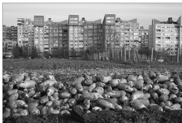
Slika 5: Pogled na Glinškovo ploščad

Med prebivalci BS 7 je mogoče zaznati različne odnose do prostora Savelj in Kleč. Nekateri so mnenja, da gre pri Saveljah in Klečah že za podeželje, saj so tam kmetije in njive. Savelje vidijo kot vas predvsem v odnosu z območjem BS 7: »To je mesto, Savelje so pa že vas.« Za druge pa to območje ni podeželje oziroma je vse manj podeželje. Po njihovem prepričanju nekaj kmetij, ki so v Saveljah, še ne pomeni, da gre za podeželje,