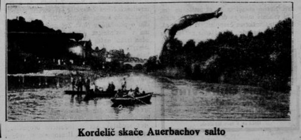
Kordelici skače Auerbachov salto