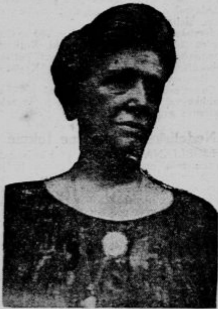
Mati pogrešanega francoskega letalca Nungesserja

Tekom prvih 16ih ur je Vezuv izbruhal nad 2 milijona kubičnih metrov lave. Prebivalstva se je polotila razumljiva panika. Ljudje se boje, da jim preti katastrofa, kakršna je zadela prebivalce teh krajev januarja l. 1916. Takrat je ognjenik napravil velikansko gnotno škodo in je zahteval tudi mnogo človeških življenj.