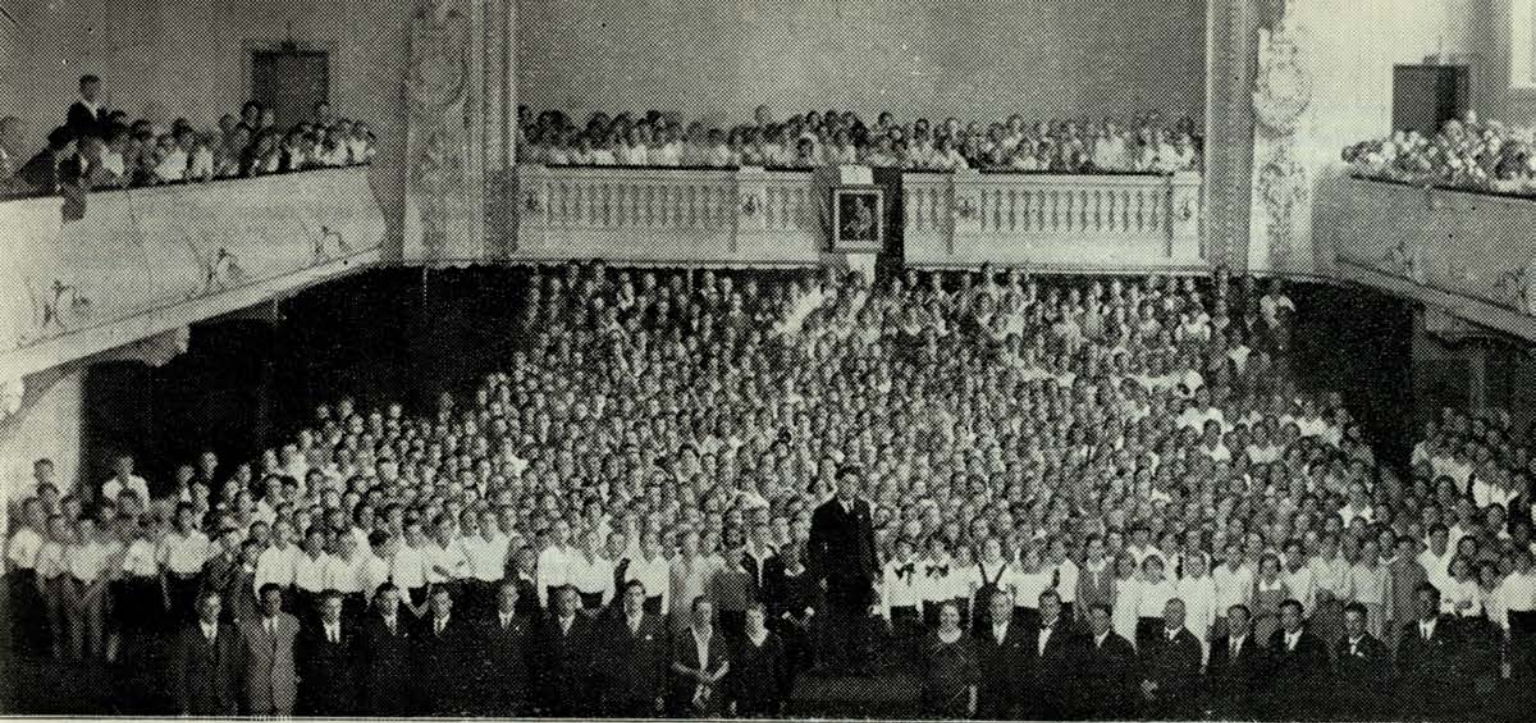
Mladinski zbori na koncertu v «Unionu».

7.) Predsednik poroča, da je ministrstvo za promet odobrilo za slavje v Sv. Juriju in Celju dne 12., odnosno 15. maja le 50 % popusta na železnicah sodelujočim pevcem, enako kakor ostali publiki. Zaradi premajhnega upoštevanja naloge pevcev pri slavju se uprava župe poveri, da energično zahteva za naše pevce 75 % popusta.