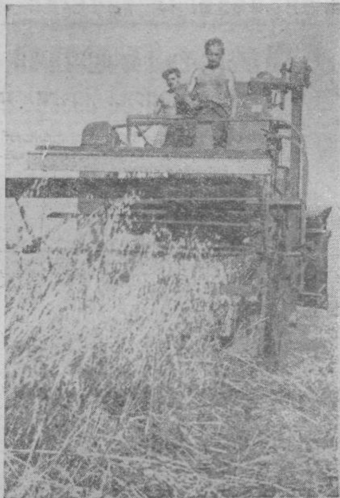
Kombajn hkrati zbira žito, ga mlati in stiska slamo v bale.

NAJ NE BO BREZ »NAŠE SKUPNOSTI«, glasila Predsedstva Zveznega odbora SZDL Jugoslavije,