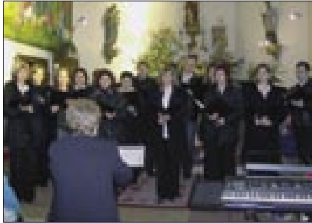
Mešani pevski zbor August Pavel

V nedelo, 14. januarja 2007, so se pevski zbori z Goričkoga in Porabja zbrali v Pečarovcaj na novoletnem koncertu.