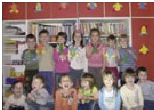
Gornjeseniški malčki so se takoj lotili dela

Orffova glasbila) ter za razne materiale za likovne dejavnosti (kartoni, barvni papirji,