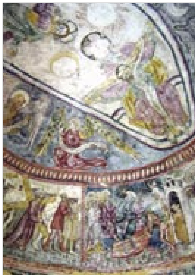
Vojvodska delavnica v zač. 15. veka v Seli, veličastna vsebinska uresničitev pasijona s kejpami Kristušovoga vhoda v Jeruzalem, pa kak nosi križ, Prestol milosti (»tronus gratiae«, de Bog Oča drži križanoga sina), Vstali Kistuš, pa ešče lev, simbol evangelista Markoja in Matejev angel s pavjimi perotami

veka). Ništerni pa mislijo, ka bi izvore trbelo videti tüdi v rotundaj iz 11. in 12. veka blüzi Prage in kama naj bi, če ne pozabimo na posebni okrogli tip kostnic (ossarium), te fele arhitekturni tip najšo pot tüdi v prekodonavski prostor, se pravi tudi v naš srednjeveški svejt, gde je najti najbližije paralele bar v Kallósi in Vitynyédszentpáli. Selanska je, istini na lübo, najlepša. Od velikij meštrov je tak napravljena, ka jo vöni pa notri harmonizerajo ritmično zgrablene krasilne parte, povejmo lizene (navpični, malo vöstopajoči zidec), pa iz cigla vönacirani dekorativni detajli; vse vküper se kaže kak pravo doživetje romanskoga düšnoga, v sebe obrnjenoga žitka