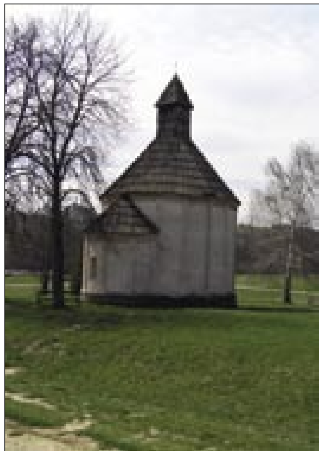
Rotunda v Selu/Nagyótlak, eden najlepših srednjeevropskih romanskih spomenikov, pogled s severovzhodne strani

v Seli. Zagvüšno svojemi tali Kobiljanskoga potoka preleji pi džündž. Vsakša pot k njoj, gdakoli že, je leko svetek. Davno nazaj je bila gori postavljena po vouli erešnjij, visokij patronov. Mislimo, ka bi leko biu tau nešče iz bližine vogrskoga dvora, se pravi nešče, što je biu blüzi krala Andreja/Endreja II. (1205-1235) in zazidana v časi po 5. križarskom pohodi, nindri pred sredinov 13. veka in tak bi tau leko biu spomin na cerkev Božjega groba v Jeruzalemu. Takše fele arhitektura, se pravi okrogla cerkev, ma ovak velko preminočnost, zatok ka leko viske mujštre prepoznamo davno nazaj, povejmo v rimskom Panteoni (ok. 115-125), starokrščanskij