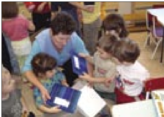
»Pa pogledjmo, kaj se skriva v zaboju!« Posnetek iz števanovskega vrtca

nem delu, poskrbi tudi za primerne strokovne materiale. Tudi pred božičem smo dobili