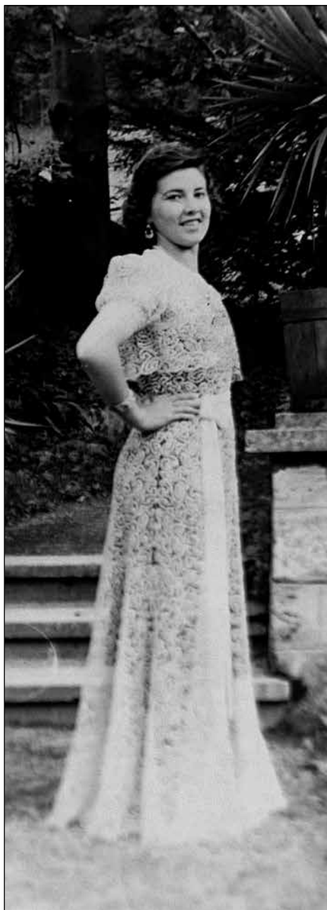
Klekljana obleka.