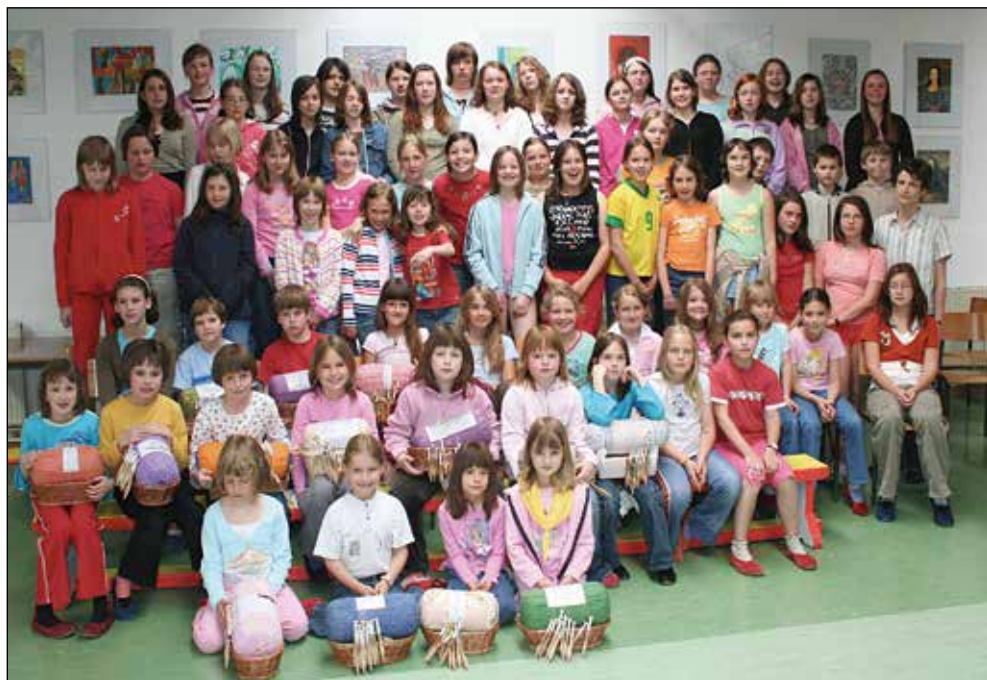
Generacija klekljaric iz Železnikov v šolskem letu 2006/2007.

Vsako leto izvedemo šolsko tekmovanje iz znanja klekljanja.