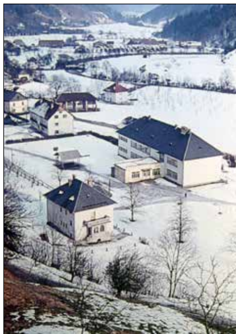
Stara osnovna šola Železniki.