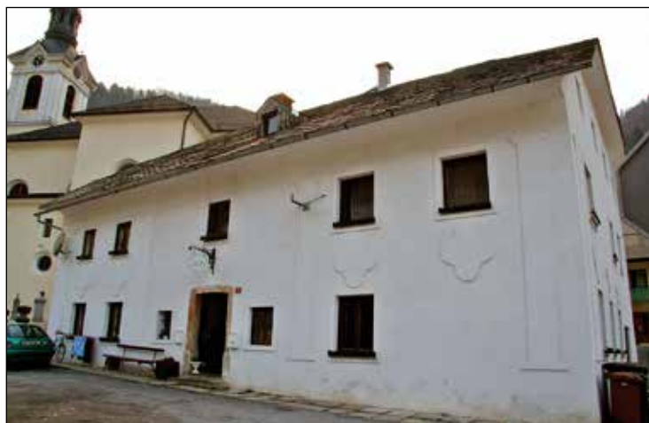
Pri Štalc.