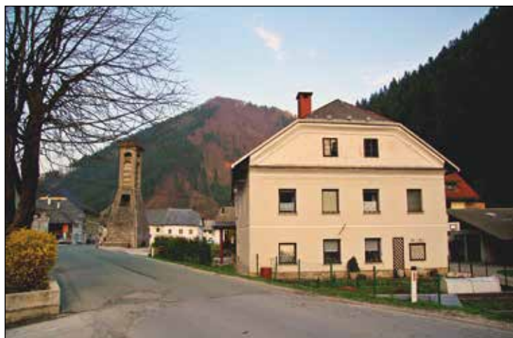
Ferbarjeva hiša.