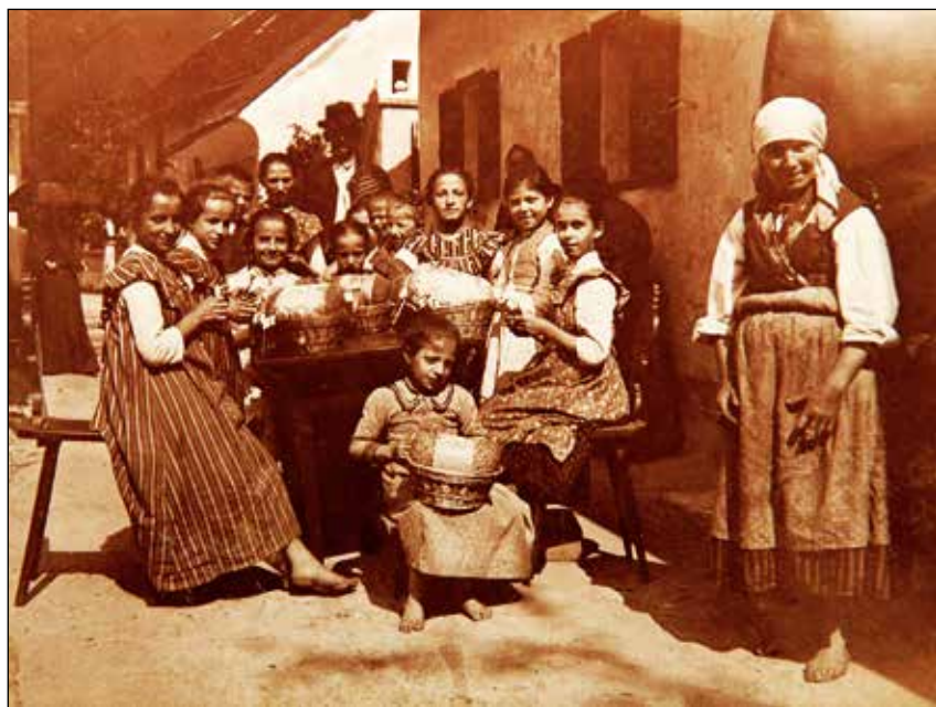
Otvoritev čipkarske šole, 1907.