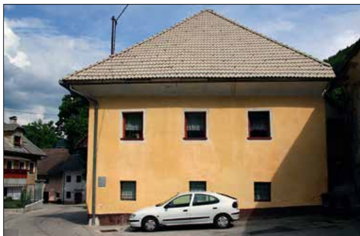
Pri Leonu.