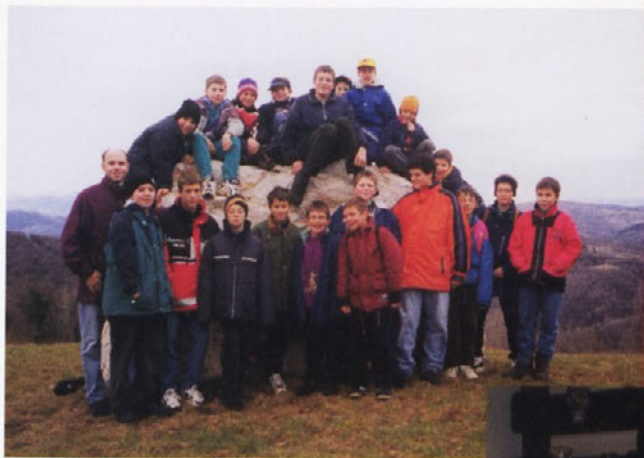
Srečanje ministrantov na Sveti Gori, sobota 11. december 1999