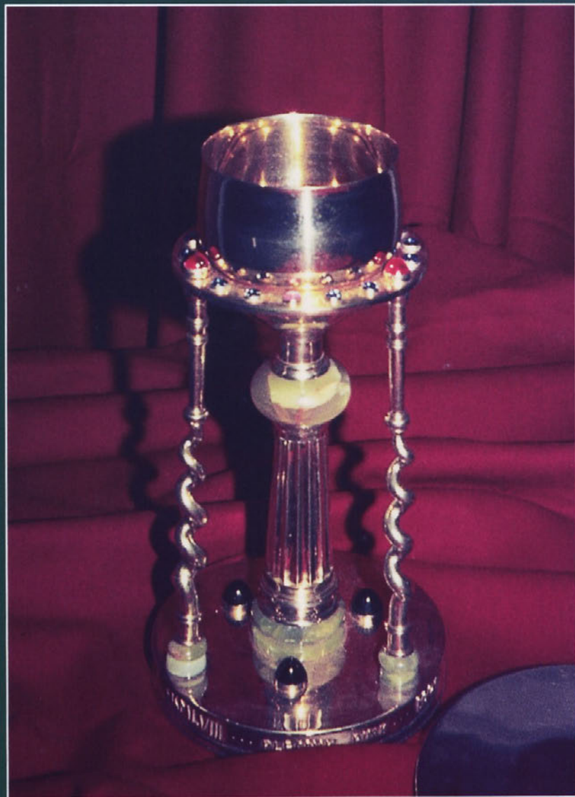
Kelih arhitekta Jožeta Plečnika, na podstavku je vgraviran napis: Ego autem steti in monte sicut prius anno Mariano 1958

Pred mano si neskončno sveta Božja kri! O Jezus, naj se nagnem k rani tvoji, s krvjo rešilno mi napoji!