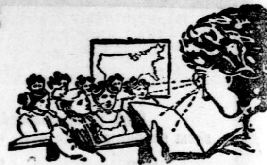
Nova stekla za daleč in bližino, važno za dalekovidne.

Bodite previdni pri nakupu očal, ker le specialist vam lahko določi pravilno očala in Vas strokovnjaško postreže.