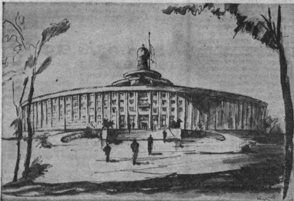
Osnutek stavbe CK KPJ v Beogradu.