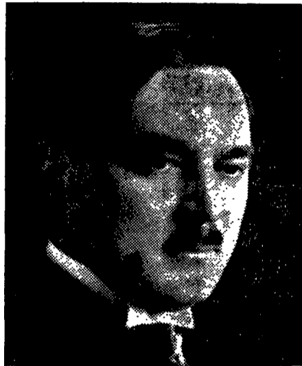
Ministrski predsednik dr. Stojadinović

Medtem italijansko časopisje še naprej silovito napada Anglijo. »Iz Londona se slišijo glasovi, naj se Italija nikar ne spušča v kakšne avanture v Afriki, ker da je njena zgodovinska in kulturna naloga, da brani evropsko civilizacijo na Brennerju in na Jadranu. Angleška diplomacija nas je zopet začela strašiti z germansko in vseslovansko nevarnostjo. Zopet bi nas rada zaposlila v Evropi, da bi stali na straži za kakšne velike ideale, samo da bi pustili na miru Afriko, kjer še ni vse ozemlje razdeljeno. Toda Italija bo storila, kar briga njo samo. Ne bo več žandarm nikogar. kaiti