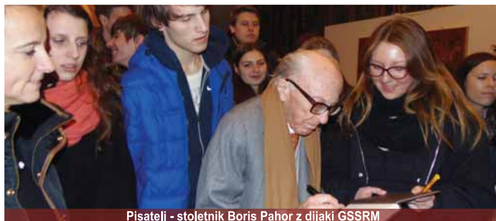
Pisatelj - stoletnik Boris Pahor z dijaki GSŠRM

Jesen in začetek zime je čas za številna tekmovanja, naši dijaki so se tako preizkušali v logiki, naravoslovju, razvedrilni matematiki, košarki, astronomiji, pravu in še čem. Najboljši so seveda dobili vstopnice za državno tekmovanje, kjer so nadaljevali z odličnimi predstavami. Na državnem