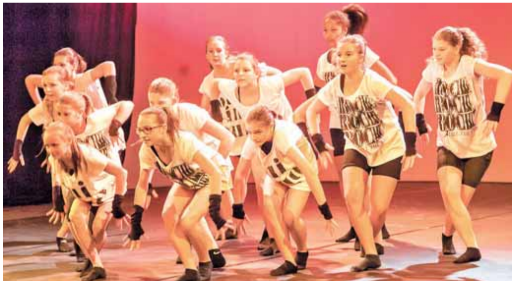
Mladinska show dance skupina je s točko Jungle drum ogrela plesni pod kamniškega kulturnega doma.

odlično plesati. Potešili so najrazličnejše in še tako zahtevne okuse, saj so predstavili paleto plesnih zvrsti v različnih starostnih skupinah. Najmlajši so pokazali nekaj baleta in otroških plesov. Da so