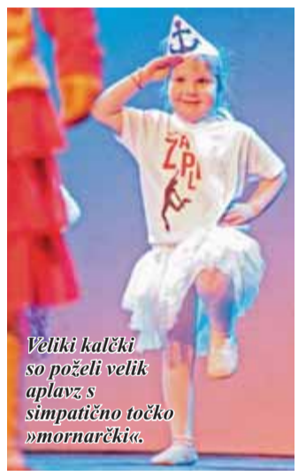
Veliki kalčki so poželi velik aplavz s simpatično točko »mornarčiki«.