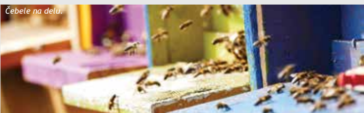
Čebele na delu.