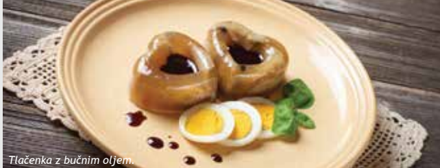
Tlačenka z bučnim oljem.

JERUZALEM SAT OLJARNA IN MEŠALNICA D. O. O. PON.-PET.: 8.-14. SOB.: 8.-11. NED.: zaprto VOV: PET.-NED.: 9.-15. 7. 9. 2019 - Praznik buč.: 10.-16. Ljutomerska cesta 4, 2277 Središče ob Dravi DOV ✓ t. 051 439 049 VOV ✓ e. ogledi@oljarna-sredisce.si, www.oljarna-sredisce.si