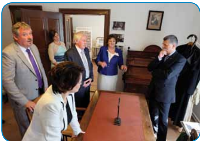
Obisk predsednika parlamenta Lászla Kövérja v Kuharjevi spominski hiši

»državna srečanja«. »Zdaj v globalnom svejti je vse malo ovak kak prva. Vse informacije pridejo prejk interneta, vsi vse vidijo pa vejo. Gda pridejo na srečanje, si dosta kaj nauvoga več ne morejo pripovedjati.