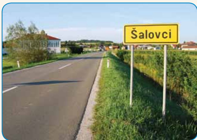
RAD BI BIU, KA BI LIDGE BAUKŠE IN LEPŠE ŽIVELI stran 5

»POGLEDNIMO NAZAJ: GDE SMO ZAČNILI PA KELKO SMO DOSEGNILI«