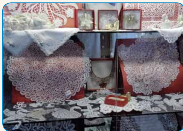
LJUBLJANSKA LARMA OD BLŪZI PA DALEČ stran 10