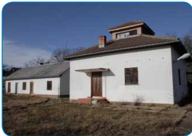
V kasarni v Čöpincaj de po nauvom graničarski muzej

Po zgotovljeni šauli se je nej zaposlo v toj firmi, vej pa so