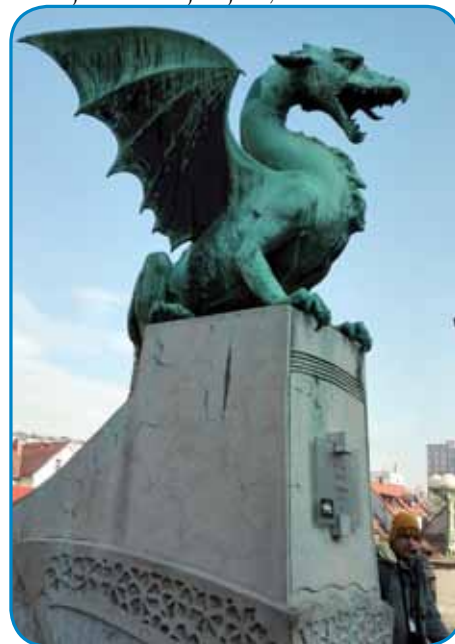
Simbol Ljubljane najdemo na vsakšom kiklej - na Zmajskom mostej tö

Na Mestnom trgi najdemo restavracijo »Güžina«, gde leko spoznamo gastronomijo prekmurske krajine. Ne falijo »gibanice«, cuj k žmanoj prekmurskoj šunki pa leko koštavamo dobro kraplo z zamenic s krajine kraj Müre. Restavracija je edna od najdrakši v Ljubljani, za-