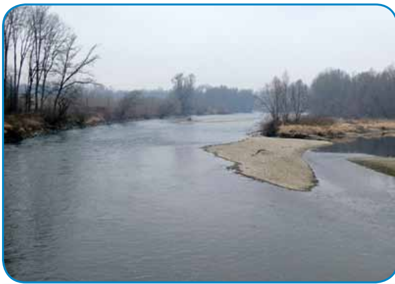
Mura ali »slovenska Amazonka« je dolga 438 kilometrov, izvira v avstrijskih Nizkih Turah in se v hrvaškem Legradu združuje z Dravo