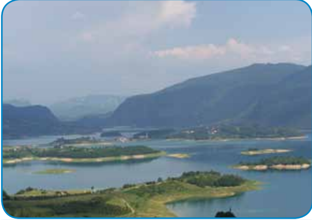
Ramsko jezero s frančiškanskim samostanom