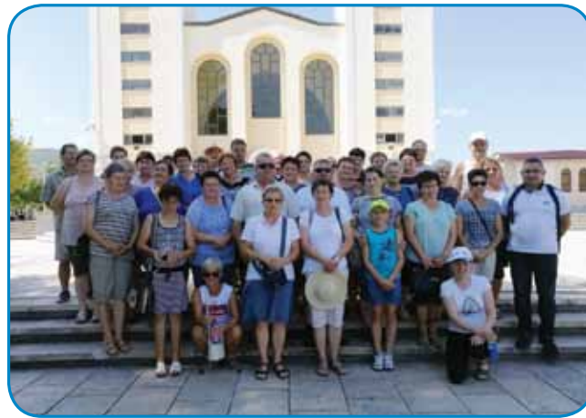
Pred cerkvijo sv. Jakoba v Medjugorju

smo se odločili, da gremo naslednji dan na »Križevac« (520 m) v zgodnjih jutranjih urah. Do vrha smo molili križev pot in