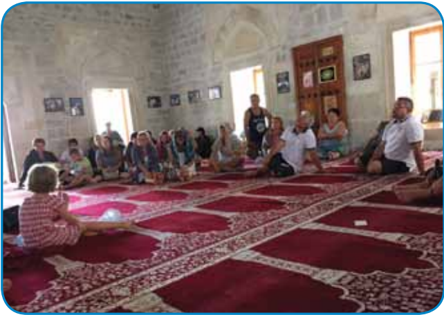
V mošeji (Počitelj)

kom z Gornjega Senika skoraj leto dni pripravljala to romanje. Sama sem na podlagi mojih izkušenj sestavila program in moram priznati, da je tudi zame, ki sem vajena turističnih skupin, bil to eden izmed lepših izletov. Skupina je bila zadovoljna in srečna, da je videla in doživela toliko raznolikih krajev.