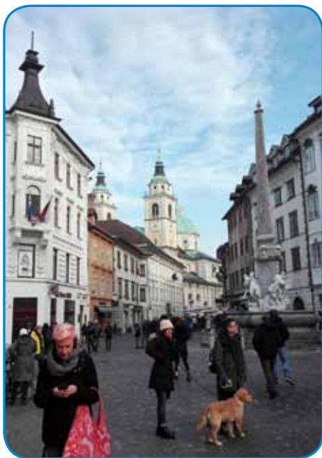
Katedrala svetoga Nikolaja pa Robbov stüdenec z Mestnoga trga

Ljubljanska tržnica je sploj veuka, pa rejsan vsega živoga tam odavajo. Biu je sobotin zranek, kufári so glasno ponüjali svojo blago: največ je bilau zelenja, sada pa rauž, depa na vsakšom kiklej so odavali toplo gesti