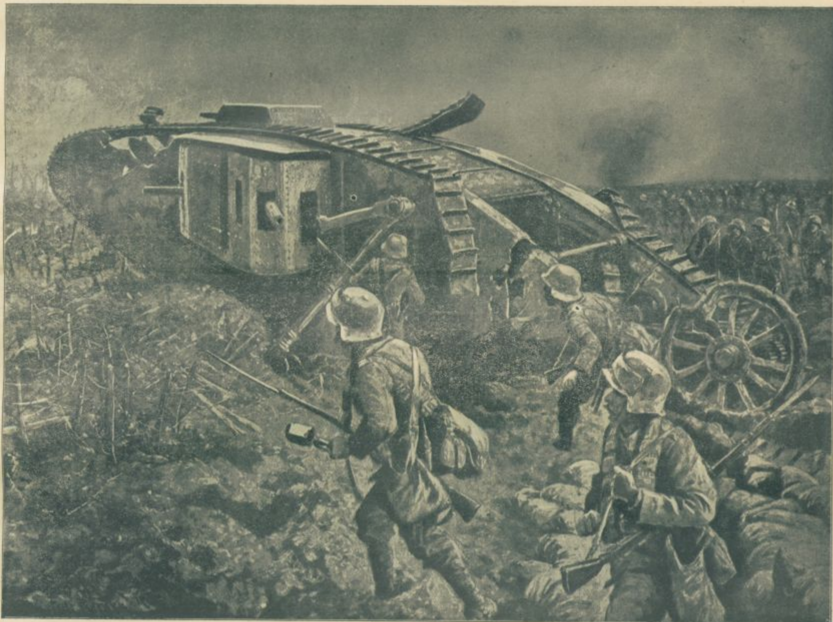
Vsled topniškega obstreljevanja razdejan »tank« na zapadnem bojišču.