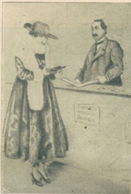
Pri uredniku. - „Jaz bi rada inserirala zaročni oglas; toda prosim za znižano ceno, ker se večkrat zaročim.“

sedanjih dneh zaliti ljudje od suhih! Vzbujaajo nevoščljive poglede in misli o preobloženih mizah. Pa niso vselej utemeljene, ker se redi marsikdo ob niču in se suši marsikdo ob izobilju vsega. Kdor je vitek, naj bo vesel svoje lepote in naj se ne zgleduje ob grdi debelušnosti drugih; debelost je nevarna za zdravje, posebno poleti.