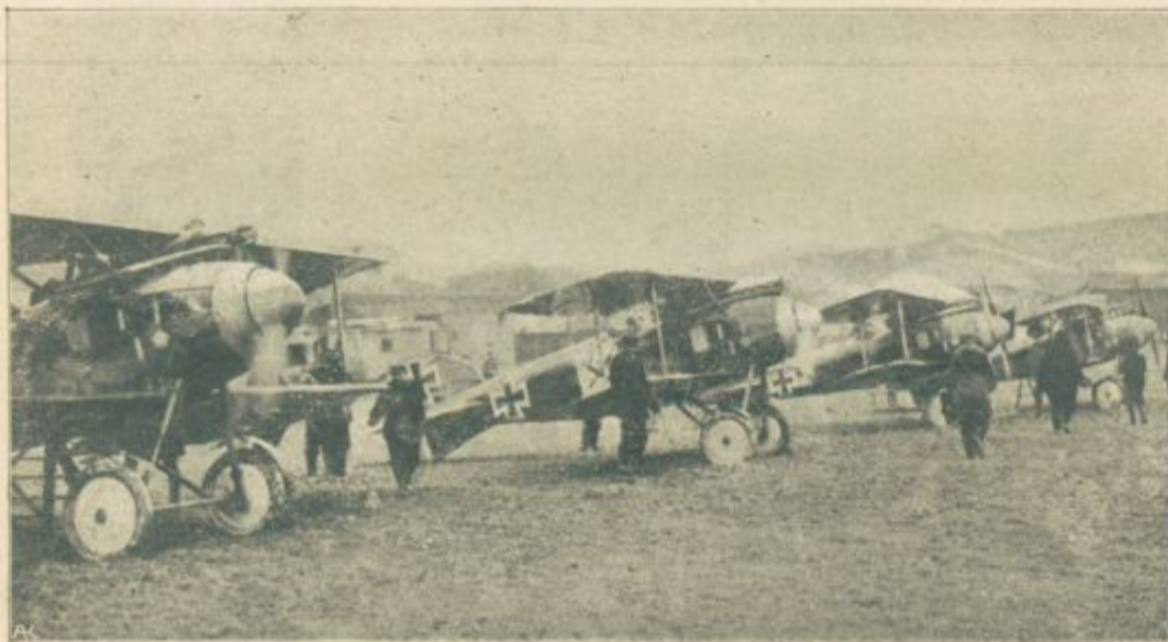
Najnovejša vrsta nemških bojnih letal pred poletom.

Naprej, ne zaostati! Za tistim ovinkom se mora začeti gozd redčiti! Glej, megla je začela ovijati gozd, za drevesi že čepi mrak in se plazi za meglo. Samo sedaj ne zaostati!