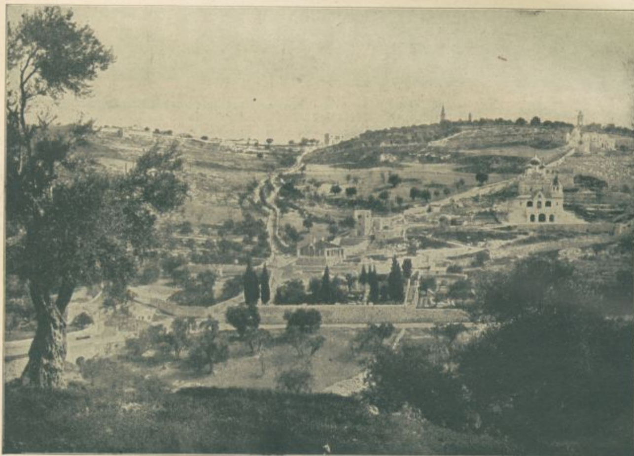
Oljska gora v Palestini, kjer so Angleži bombe metali na turške vojaške naprave.

Rusi se umikajo na celi črti v Galiciji. Naši so zasedli Bučač in Delatin. Rusi gredo nazaj proti Črnovicam; ustalili so se pri prelazu Kirlibaba. Notranji nemiri v Rusiji se vedno bolj širijo. — Finci so v svojem deželnem zboru razglasili Finsko kot samostojno kraljestvo; ruska začasna vlada pa nima moči, da bi to zabranila. Kerenski se pri vladi trudi spraviti v red vojaštvo, a se mu ne posreči. Pravijo, da bo vlada Kerenskemu izročila neomejeno oblast. — Miroljubni ruski narod je vojske sit, državniki njegovi so pa s pogodbami vezani z Angleži in Francozi in zato si ne upajo skleniti zase miru. Ko bi Rusija to storila sedaj,