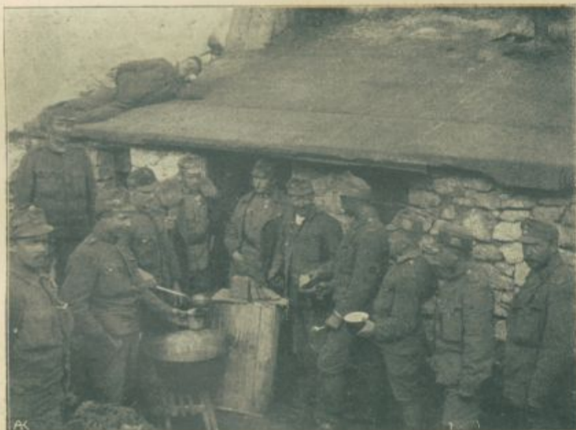
Opoldanski počitek in razdeljevanje menaže sedm. lovsk. bat.

Kmet pa nabere polen, meče in teče za potepuhom. Zasmehujooči klici njegovi postajajo slabejši. Dež pa vleče, vleče svoje črte, gosteje in gosteje, dokler ne izbriše obeh s pokrajine.