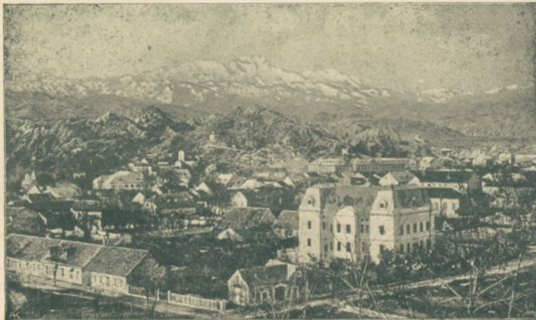
Cetinje, glavno mesto Črnogore. Najvišji vrh je Lovčen; stavba, zaznamovana s X v skali, je guvernerstvo; največje poslopje spredaj je rusko poslaništvo; stavbi nad A sta gledališče.

Mati je mislila od kraja, da se je deklet potuhnilo: dala ji je torej par gorkih. Ko pa to ni pomagalo, jo je nadržnila z vročim jesihom, drugi dan pa ji je dala piti žganja s pelinom.