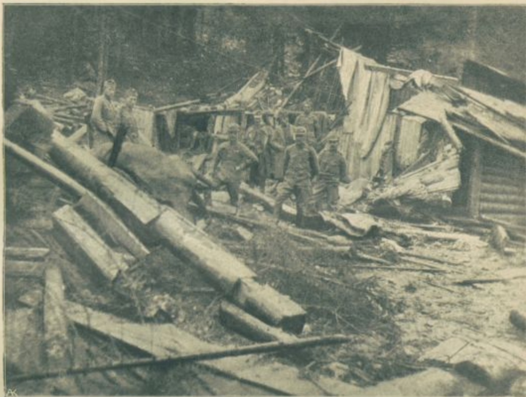
Učinek italijanske granate.