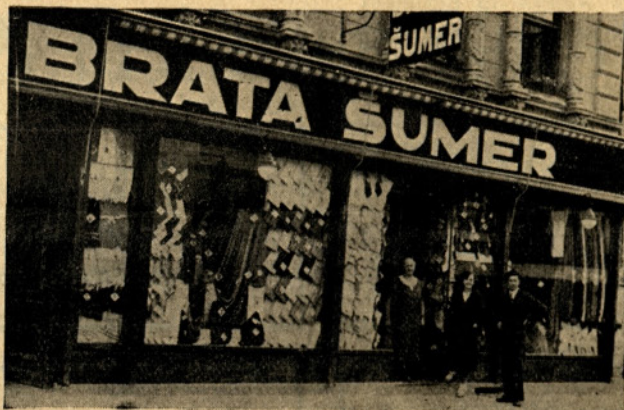
MANUFAKTURNA TRGOVINA, CELJE, PREŠERNOVA UL.