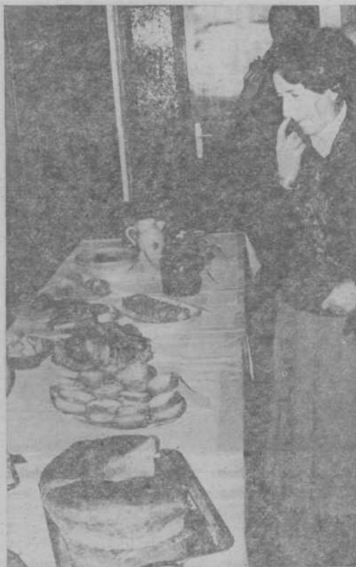
V medvoškem DONITU so pripravili zanimivo razstavo domačih jedi