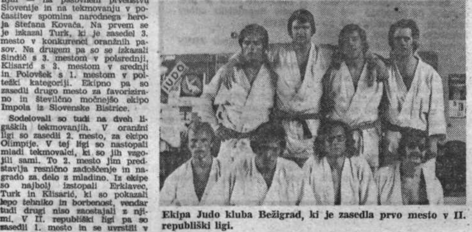
Ekipe Judo kluba Bežigrad, ki je zasedla prvo mesto v II. republiški ligi.