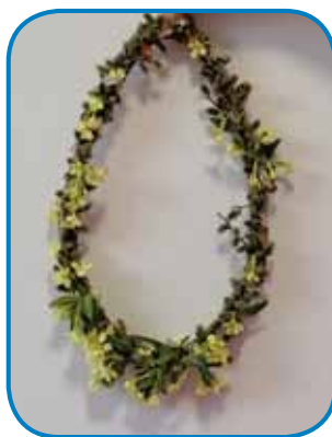
2. mesto: Zoé Odett Zsitek, Monošter