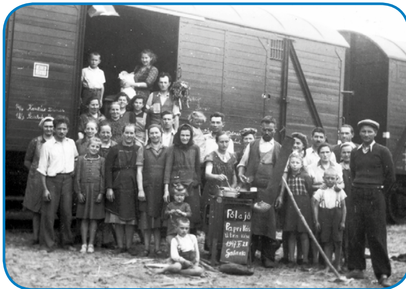
Vogrské družine z varaša Galanta, štere majuša 1947 čakajo, ka je cug odpela - v nauvo domovino

prejk na Madžarsko s sebov odneséjo. Veuko znamenje pa je dokument emo na pariškoj mirovnoj konferenci tö: če rejsan bi Sovjeti nutprivolili v vödöpelanje vsej Vaugrov s Češkoslovaške, so ZDA (USA) tau zavolo podpisanoga kontraktušaja nej njale. Vleti 1946 je vöprišlo edno nauvo rendelüvanje, šteroga je dopüstito tzv. »reslovakizacijo«. Tau je znamenüvalo, ka leko Madžari »pá Slovaki gratajo« - - kak