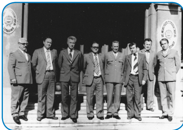
Slovenski gasilci (sogovornik je tretji s prave strani) so se leta 1977 v Sombotelu srečali z vogrskimi gasilci

silski zvezi Murska Sobota, stera je bila te ena največših takših zvez v Sloveniji, vej pa je povezovala 134 družtev. Tau delo je oprav-