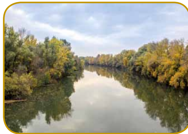
Reke s vküpnim imenom Körös prihajajo z Romanarskoga na Vogrsko, gde se vlejejo v Tiso - pred njinov regulacijov je bila krajina müzgasta

Eške gnes je najlepši tau varaša arboretum, v šterom so pred dvöma stoletjoma začnili saditi drejve s cejloga sveta - zdaj najdemo tam 1600 fajt drejv ali grmauvdja, 250 fajt drugi rastlik in 150 fajt ftičov. Szarvas pa se najbole