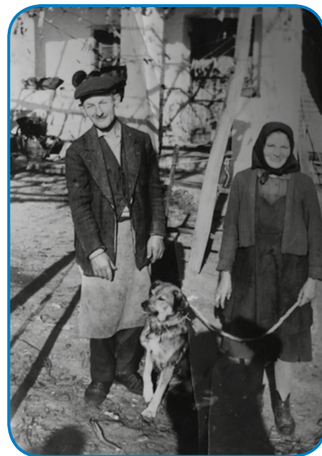
Mati pa oča s psaum pred domanjo ižo

vaul kak z drügimi živalmi, leko sem delat odo. Zaranka, prva kak sem z daumi odišo, te sem je spolago, zadvečerek sem djajca dolapaubro pa ka trbelo, sem še tanapravo. Prvin se je bola splačalo s kokauši spravlati, zdaj že nej tak, zato ka drago je sildje.«