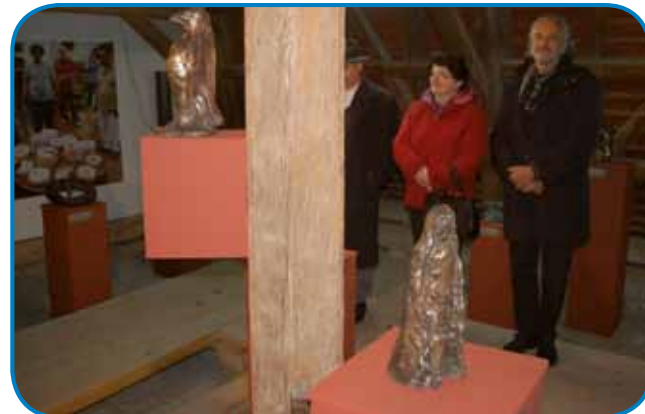
Razstava skulptur v bronu v podstrešnih razstavnih prostorih lendavskega gradu

Podstrešni razstavní prostor lendavskega gradu je poln skulptur v bronu, ki so nastajale na mednarodnih likovnih kolonijah, ki jih organizirajo v Lendavi od leta 2005. Mednarodna likovna kolonija v Lendavi poteka sicer že od leta 1973, skulpture pa odlivajo v bron zadnjih petnajst let, odkar so v Galeriji-Muzeju Lendava (GML) kupili lastno mobilno