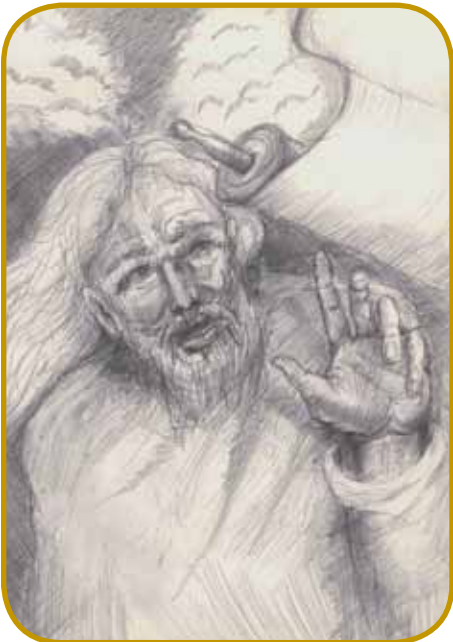
Gospaud je Ezekijeli dau eden zviti papér: »Zej ga, aj napuni tvoje tejlo« - mrtveče pesmi s papéra je prorok tomačo svojoma lüstvi

Sveti Albert je kak sin bogati starišov posvejt sveta zagledno leta 1149 na sövernom