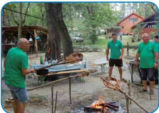
Ob tem so zakurili ogenj in pekli ribe, ki so jih nalovili v reki

prebivalcev, ki so živeli ob reki. Leta 1927 je jugoslovanska vlada za büjranje namenila denar in tudi zaposlila delavce, büjraši pa so to delo opravljali