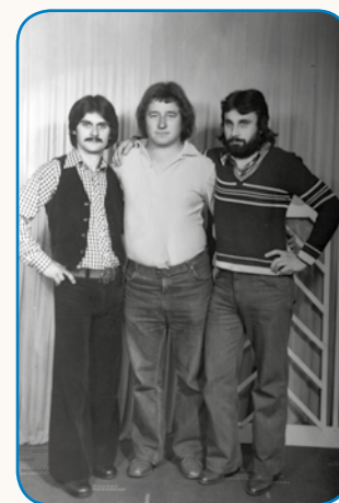
Vse stoji kak karte stran 8