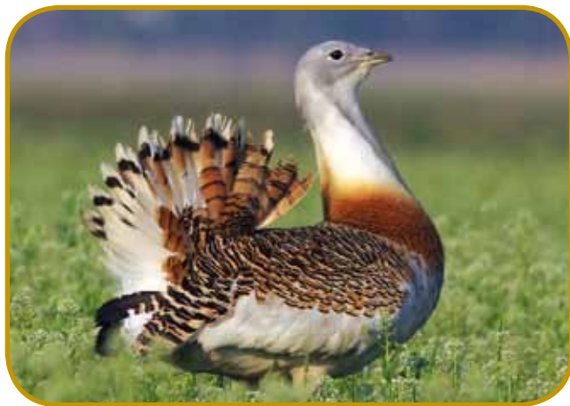
Droplja (túzkok) se najraj v našom rosagi zadržava - kauli vési Dévaványi so je vküpsteli več kak peštai, od toga tristau kokautov

Hármas-Körösa, gde je bilau edno središče Vaugrov, gda so med Karpate prišli. Zavolo visikoga bregá se je tam na léki prejk Tise prišlo, na tom veukom križpautji so se srečavali lidgé in kulture. Gnes je Csongrád mednarodno mesto grauzdja in vina. Staro varaško središče je