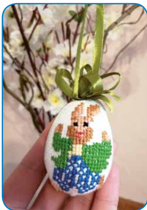
2. mesto: Imréné Szukics, Čretnik