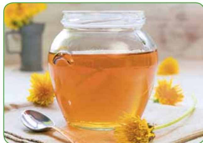
Regratov sirup

razliko od cvetov in korenin – ne uporabljajo samo v zdravilstvu, temveč tudi v kulinariki. Regratove liste za prehrano nabiramo v času pred cvetenjem rastline – takrat so manj grenki. Sezona nabiranja regrata za solate in druge spomladanske jedi je od začetka marca do sredine aprila, na senčnih mestih lahko še dlje. Cvetovi za zdravilne pripravke se nabirajo od začetka do konca cvetenja, korenine pa med majem in junijem ali med avgustom in oktobrom. Uživanje regrata ima številne ugodne učinke na zdravje organizma. Listi vsebujejo fruktozo, inulin (prehranske vlaknine), grenčino, fenolno kislino in sterole pa tudi flavonoide, kalijeve soli in kumarine. Korenine imajo enako vsebino kot listi, z izjemo zadnjih treh sestavin. Regrat vsebuje tudi vitamine A, B in C, veliko kalija in drugih