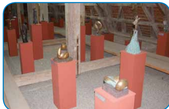
Kiparska dela umetnikov iz Slovenije, Madžarske in drugih evropskih držav