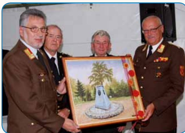
Evropa zdaj stran 4