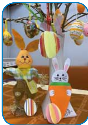
3. mesto: Mira Orbán, Monošter