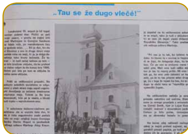
En tau prve strani 5. številke

slovenskem jeziku. Cerkev je bila polna, izmenjavali sta se slovenska beseda in pesem. Ne bomo zdaj naštevali razlogov, zakaj je mejni prehod nujnost, saj bi porabili preveč papirja, pa tudi preveč dobro jih že poznamo. 2 ali 75 kilometrov, mislim, da tu