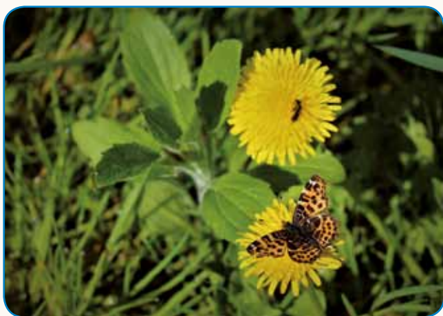
Regrat - polna skleda naravnih vitaminov stran 3