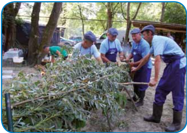
Ižakovčani büjranje predstavijo na Büjraških dnevih

žitvijo bregov reke so preprečevali, da bi se ta razlila izven svoje struge. Zgodovinski viri pričajo, da so büjraši svoje delo opravljali že leta 1871. V času Avstro-Ogrske je v avstrijskem delu za büjranje poskrbela država, v ogrskem delu reke pa so to delali običajno na pobudo