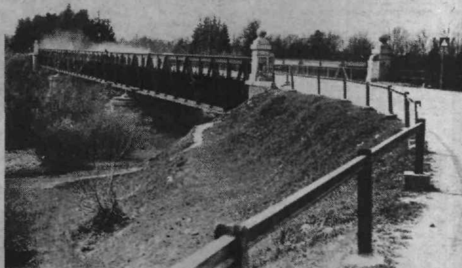
Takšen je bil včasih savski most s črnuške strani.