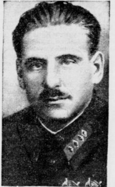
Maršal Blücher, poveljnik ruske oborožene sile na Daljnem vzhodu