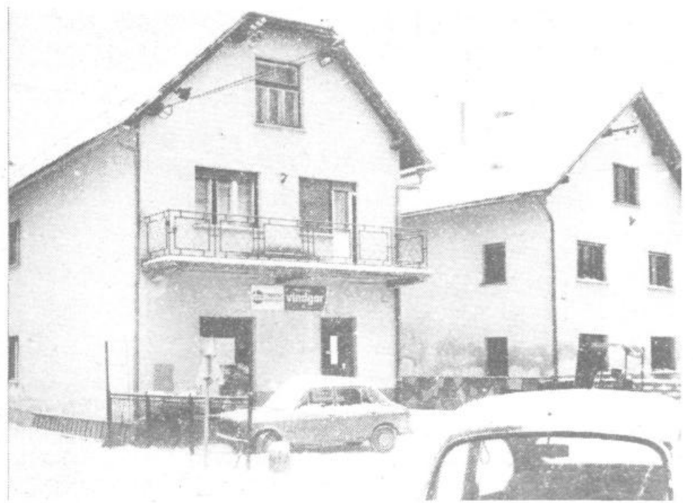
Na Igu imajo dve manjši špeceriji, ki zaradi prostorskih težav ne moreta zadostiiti vsem potrebam potrošnikov Iga in širšega podkrimskega sveta. Krajevna skupnost se je z ABC Pomurko, delovno organizacijo Tabor že dogovorila, da bi pričeli graditi na Igu najmanj 600 kvadratnih metrov velika trgovino. Pri trgovini, ki je na fotografiji, pa je še ena zanimivost. Imenuje se sicer po bližnjem Iškem Vintgarju, a nosi vztrajno ime Vintgar.

Osrednja naloga krajevne skupnosti Iga bo letos nadaljevanje obnove krajevnega vodovoda. Lani so zamenjali 1200 m cevi za 2,4 milijona, letos pa bodo