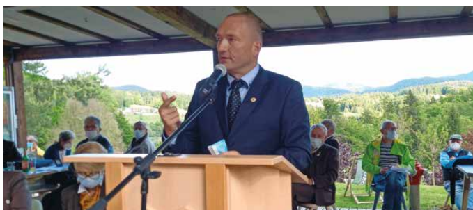
Minister za kmetijstvo dr. Jože Podgoršek je čebelarjem obljubil pomoč.