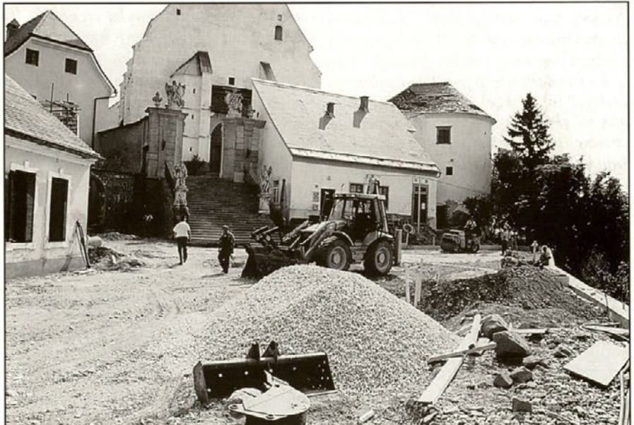
Priprava podlage za delo...