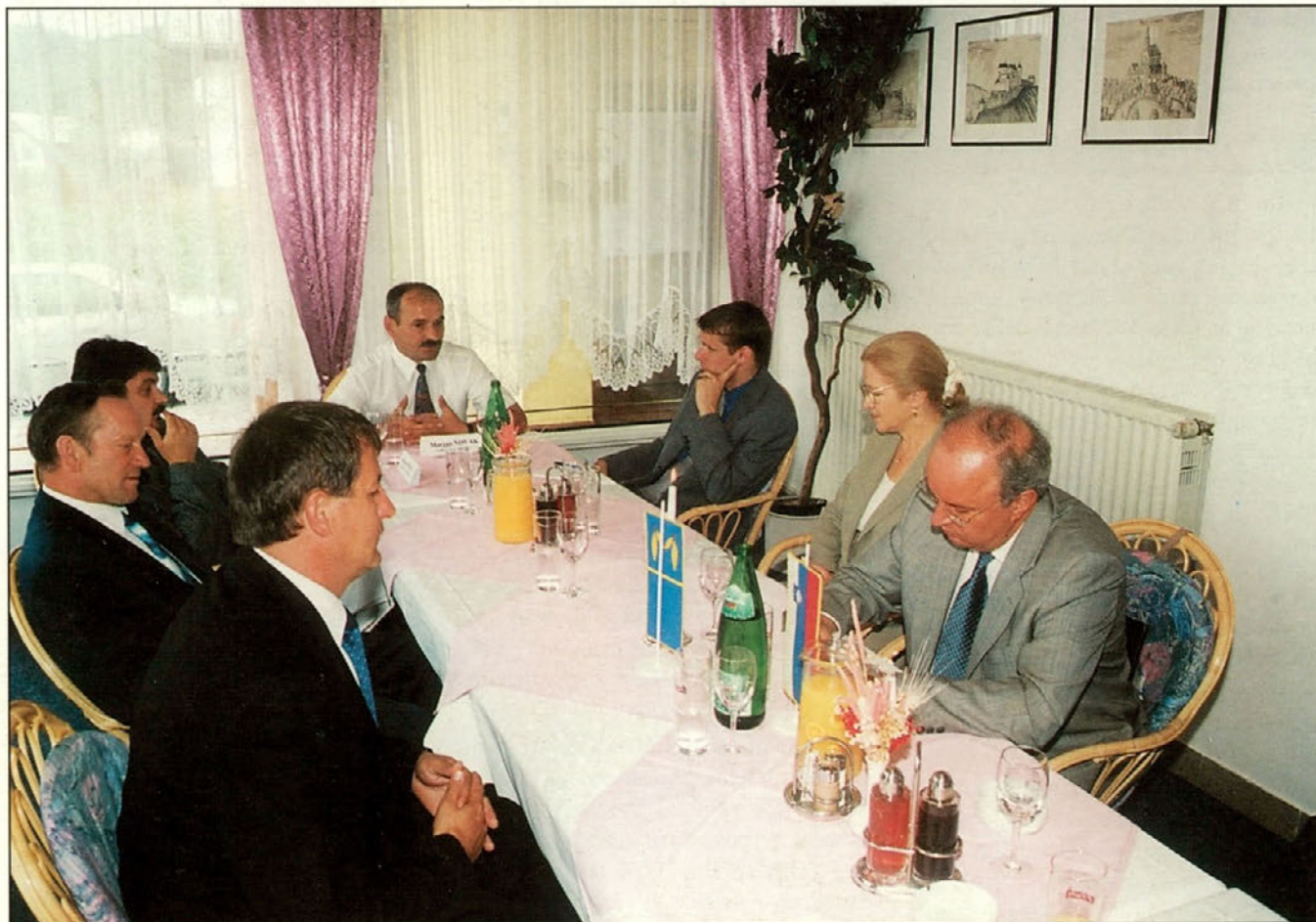
Predsednik Vlade Republike Slovenije, dr. Andrej Bajuk, na delovnem srečanju s funkcionarji občine.