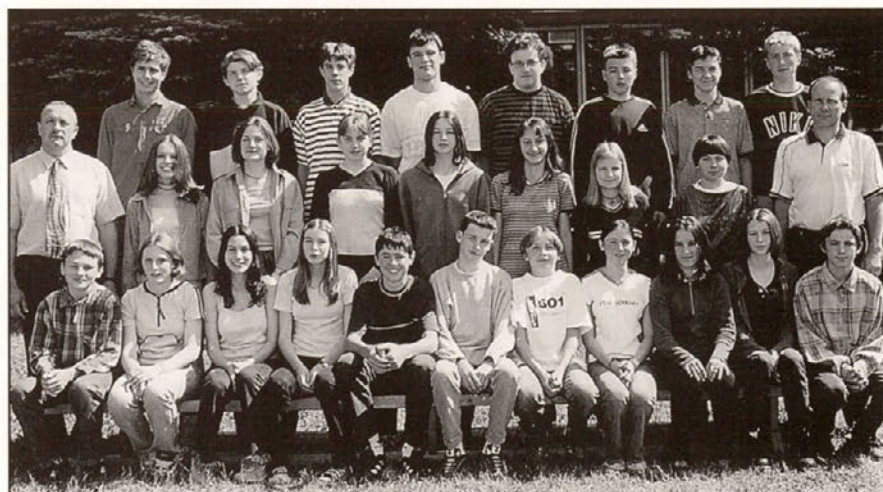
Učenci 8.b razreda skupaj z razrednikom in ravnateljem šole.

Prepričani smo, da ob prizadevnem delu sadov tudi naslednje leto ne bo manjkalo.