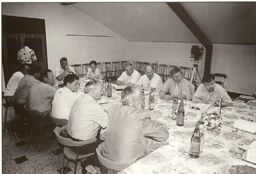
Župani oziroma njihovi predstavniki so spregovorili o problematiki, ki spremlja vse občine.