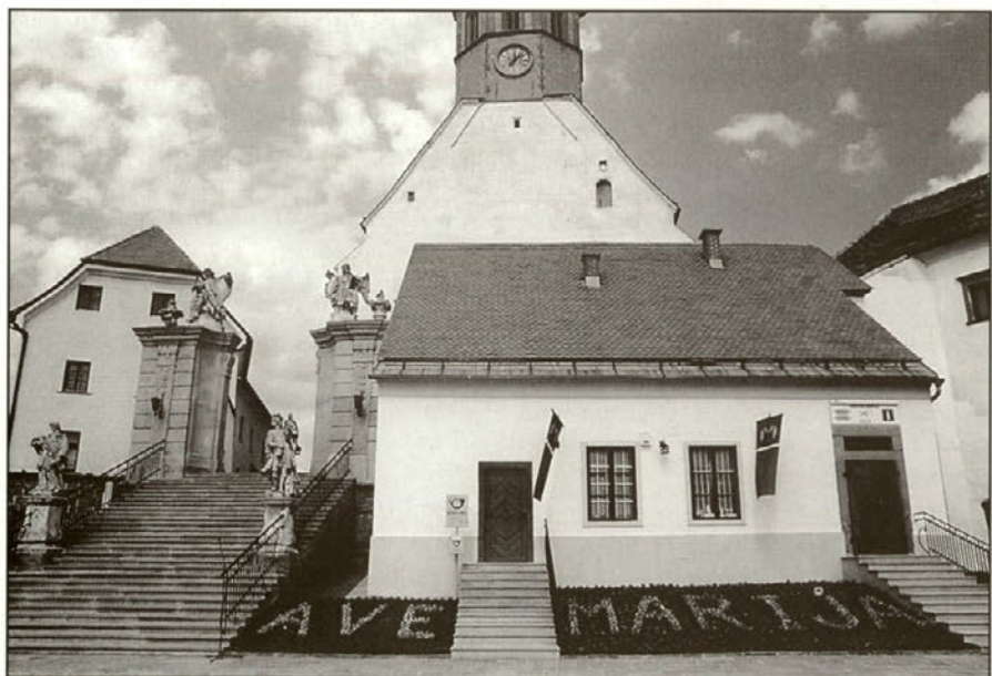
Vsakega obiskovalca najprej pozdravi napis "AVE MARIJA".

Po uradnem delu se je dogajanje s trga preselilo v šotor, kjer so nas gostinci pogostili. Za dobro voljo in ples pa so poskrbeli člani ansambla Tornado.