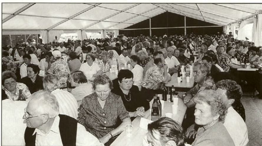
Čez 650 invalidov se je zbralo na srečanju. Pohvalno!