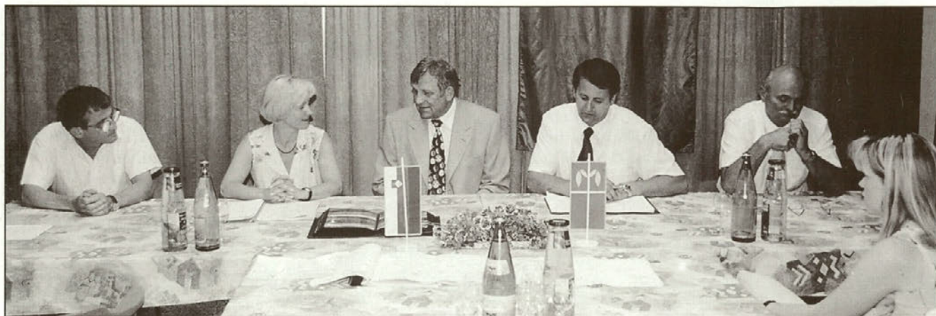
Predstavniki MOP so predstavili nadaljnjo ureditev reke Dravinje. Predstavitvi je prisostvoval tudi minister, dr. Andrej Umek.