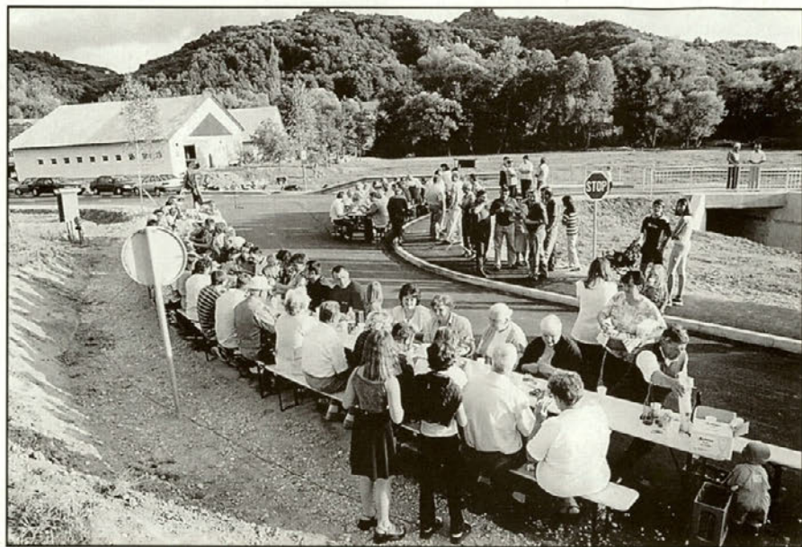
Domačini so pripravili prijeten zaključek.