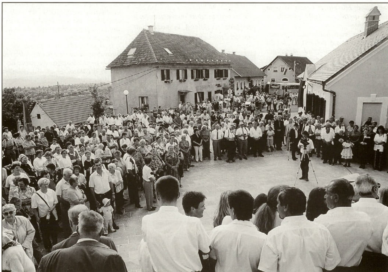
Osrednje proslave ob Dnevu državnosti se je udeležilo veliko ljubiteljev Ptujске Gore.

Le nekaj ur po regijskem srečanju invalidov se je dogajanje preselilo na trg Ptujška Gora, kjer je potekala proslava ob Dnevu državnosti in kasneje odprtje obnovljenega trga na Ptujski Gori.