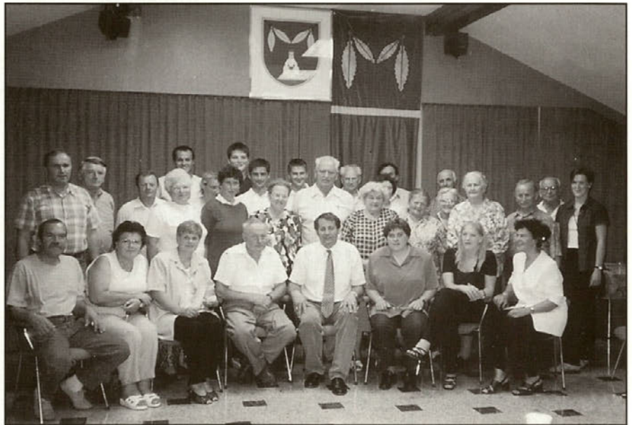
Ustanovitveni člani novoustanovljene stranke NOVA SLOVENIJA.