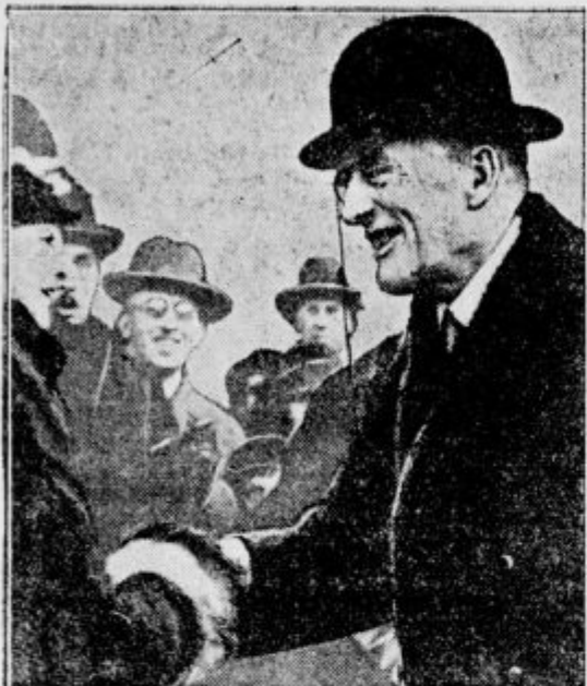
Chamberlain ob svojem dohodu v Lugano.

Dospela sva bila na švicarsko obmejno postajo Buchs, kjer sva prenočila, ker na večer istega dne ni peljal noben vlak več proti Inostem. Ko sva drugo jutro prišla zopet na