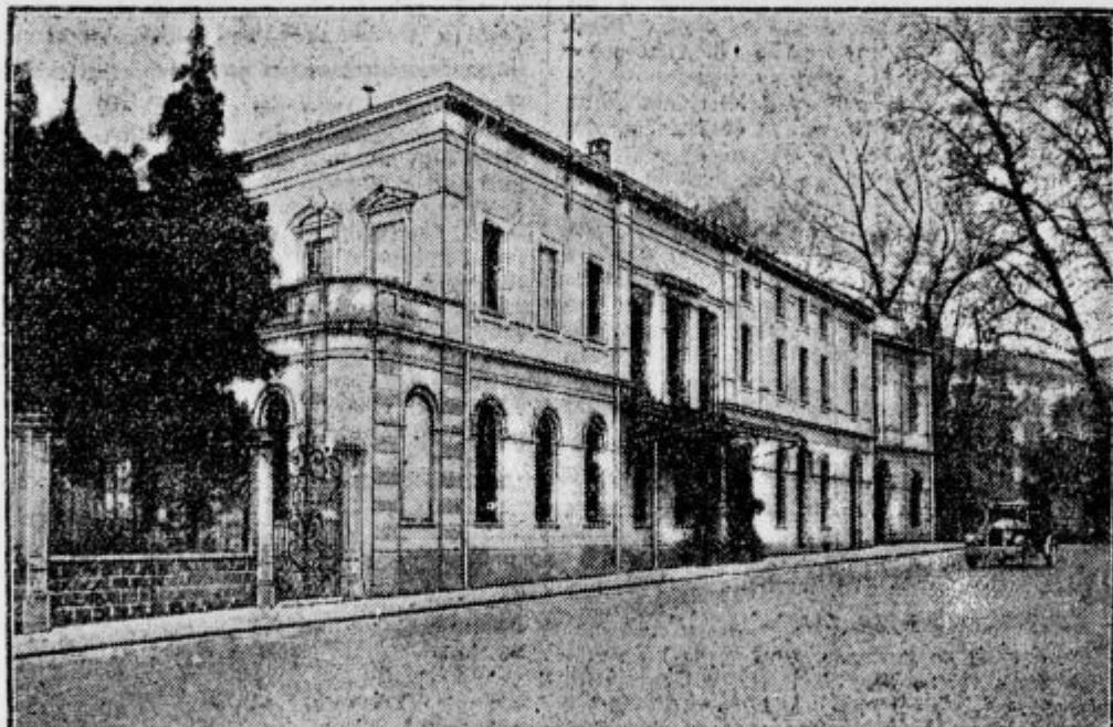
Zuraviscni dom v Luganu, kjer se pravkar vrši 53. zasedanje sveta Društva narodov.

Joj, koliko je bilo tedaj prestoni, ki smo jo napačno umeli, in moči, zaradi katere smo si toliko domišljali, pa je nismo imeli. In megalomani, domišljavci smo bili vsi, prav do zadnjega vsi. In nič boljši, morda še najslabši sem bil jaz, ki mi je moral šele italijanski karabinijer dopovedati, kako malo resnelka imamo v tužini