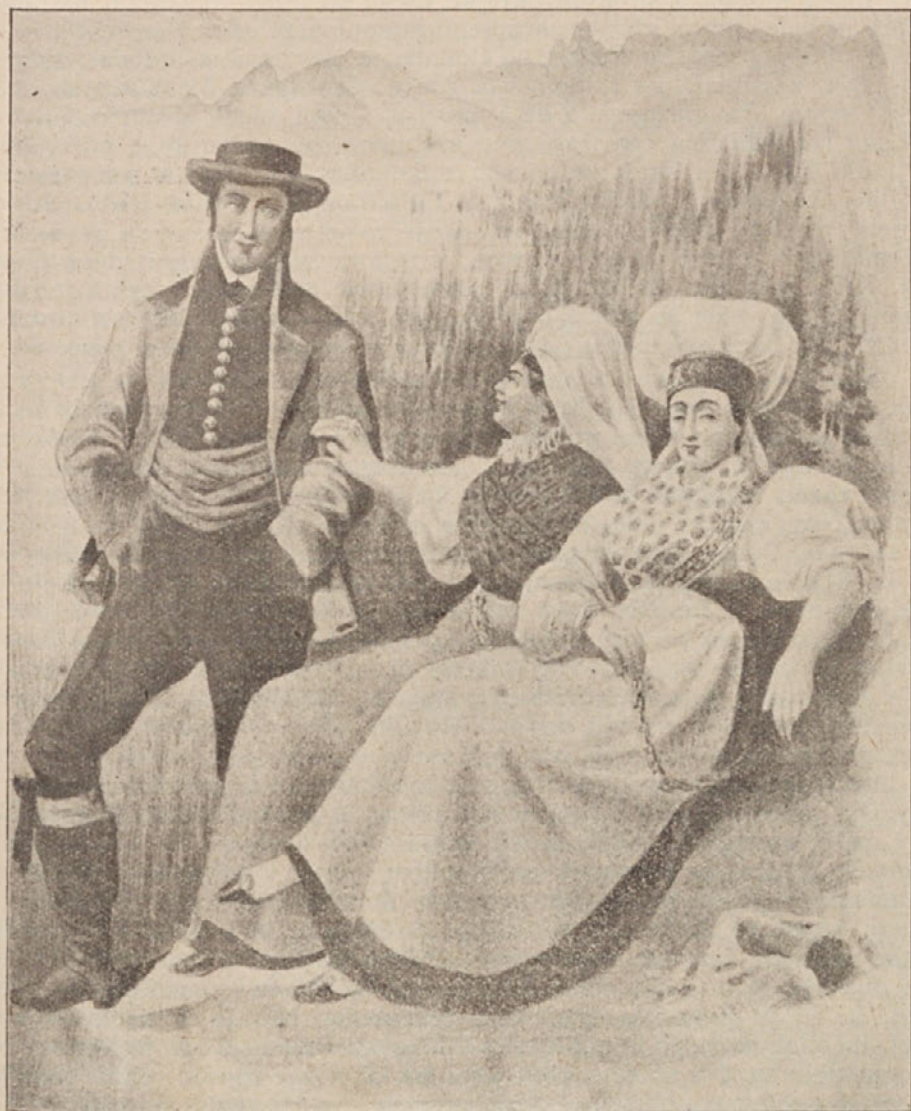
Narodna noša v Savinjski dolini krog leta 1870.

Kmečka hči iz Gornjega grada v prazniški obleki. Na glavi ima rumeno avbo z rdečimi vzorci, zgoraj je zavezana rdeča pentlja. Bela srajca ima dolge rokave. Okoli vratu in na zapestnicah je srajca