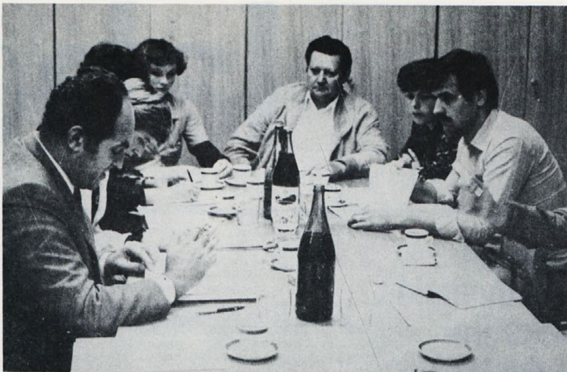
S prve seje komiteja za SLO na ravni delovne organizacije.

Tu di področje vojne proizvodnje je stvar komiteja in na drugi strani, čeprav tudi ne tako daleč od naštetih vprašanj, področje obveščanja. Informiranja tako znotraj samega SLO kot tudi širše. To širino nalog bo v prihodnje zajemalo delo komiteja, ki ga sestavljajo vsi predsedniki komitejev tozd (to so hkrati sekretarji OO ZK po tozd) ter predsednik konference sindikatov, predsednik koordinacije mladine na ravni DO Labod in seveda predsednik komiteja, glavni direktor delovne organizacije.