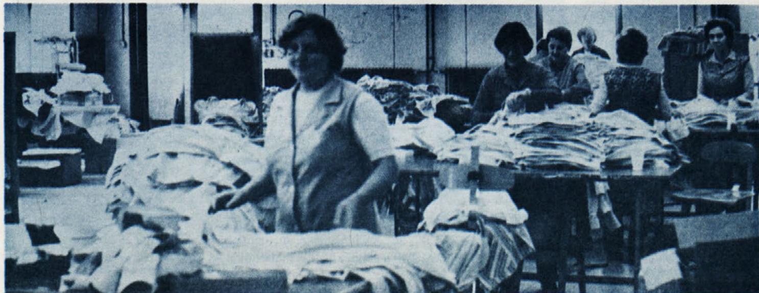
V prvi polovici letošnjega leta je slovenska tekstilna industrija dosegla dobre rezultate (Posnetek je iz licalnice v Delti.)

Ponovno je bila poudarjena potreba po večjem sodelovanju v reproverigi od predilnic do konfeksije. Raznim težavam tako na domačem trgu kot tudi ob nastopu v tujini, se bomo le homogeni uspešno postavili po robu. Za razvoj ali celo za sam obstoj tekstilne industrije je nujno, da tudi manjše delovne organizacije odločno povečujejo izvoz. Razpravljalci so opozorili na tiste delovne organizacije, ki malo izvažajo in s tem kaj malo prispevajo k pokrivanju družbenih obveznosti. Često ne prispevajo deviz niti ne za gorivo, ki ga potrebujejo za svoje obratovanje. Korenito spremembo takega obnašanja pa mora vsebovati že plan SISEOT za leto 1983.