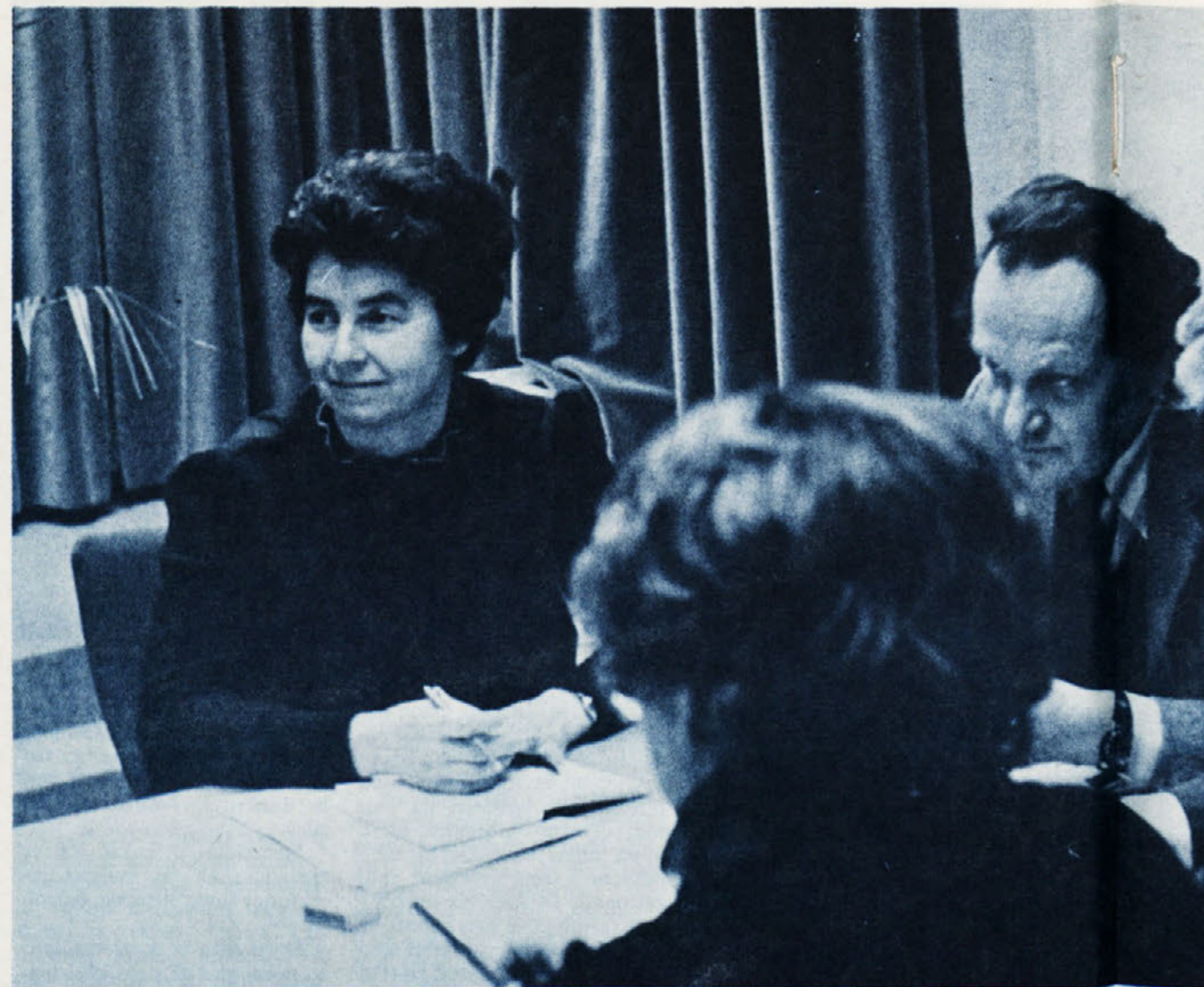
O proizvodnem delu v usmerjenem izobraževanju in o naših pripravah na to, smo v prvi polovici letošnjega leta pisali osemkrat. Na posnetku pa sta predstavnika tozd TIO-TOP na sestanku o tej temi.