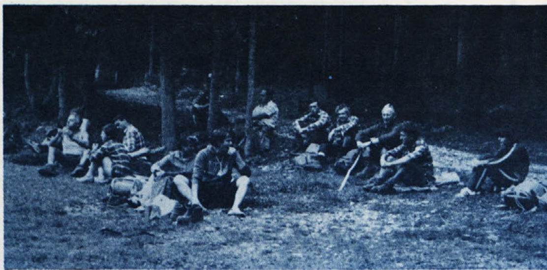
To sicer ni izlet stotih žensk na Triglav, je pa izlet Labodovih delavcev na Triglav. Točneje: posnetek prikazuje že pot v dolino.

Bila je še tema, vsi smo bili zarana pokonci, ko so se naveze podajale na pot. Na Malem Triglavu smo opazovali sončni vzhod, čakal nas je še vzpon na očaka. Koraki so postajali vse težji, kape in puloverji so bili odveč, toda premagali smo še zadnje težave. Prišli smo na vrh. Čudoviti so občutki, ko premagaš vse težave na poti in stojiš poleg Aljaževega stolpa. K