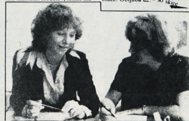
Izrezek iz revije, v kateri je bil objavljen razgovor z našima mladima kreatorkama.

Jesensko zimsko moda zelo rada sega po športnih oblačilih, ki jih dopolni z elegantnimi dodatki. Sportno in elegantno je že vrsto let moto tovarne Labod, ki izdeluje težko konfekcijo v Ljubljani, moške srajce in bluze pa v Novem mestu. Labod je ubral pravo pot in ma količino plašcev, kostimov, toliko klasičnih modelov, toliko mo-