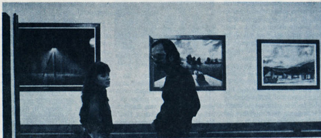
Te dni teče četrti Labodov Ex tempore, na katerem sodeluje dvajset slikarjev. Posnetek je z zaključka lanske prireditve.