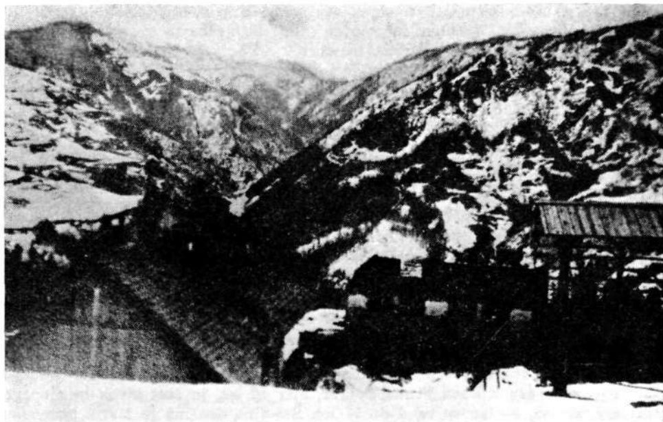
Požgano gospodarsko poslopje pri »Kopaču« na Ožboltu dne 31. oktobra 1941