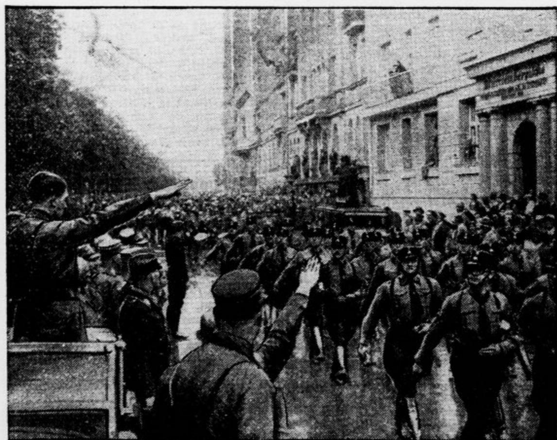
Ker je nova nemška vlada ukinila prepoved glede nošenja uniform na Bavarskem, — kakor znano, je bila Bavarska prva nemška dežela, ki je prepovedala vse uniforme — so priredili nacisti demonstrativen obhod v Monakovem pred A. Hitlerjem (levo)