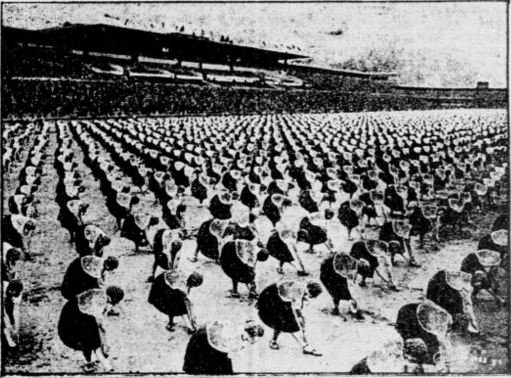
Enako število češkoslovaških Sokolic je nastopilo pri prostih vajah članic