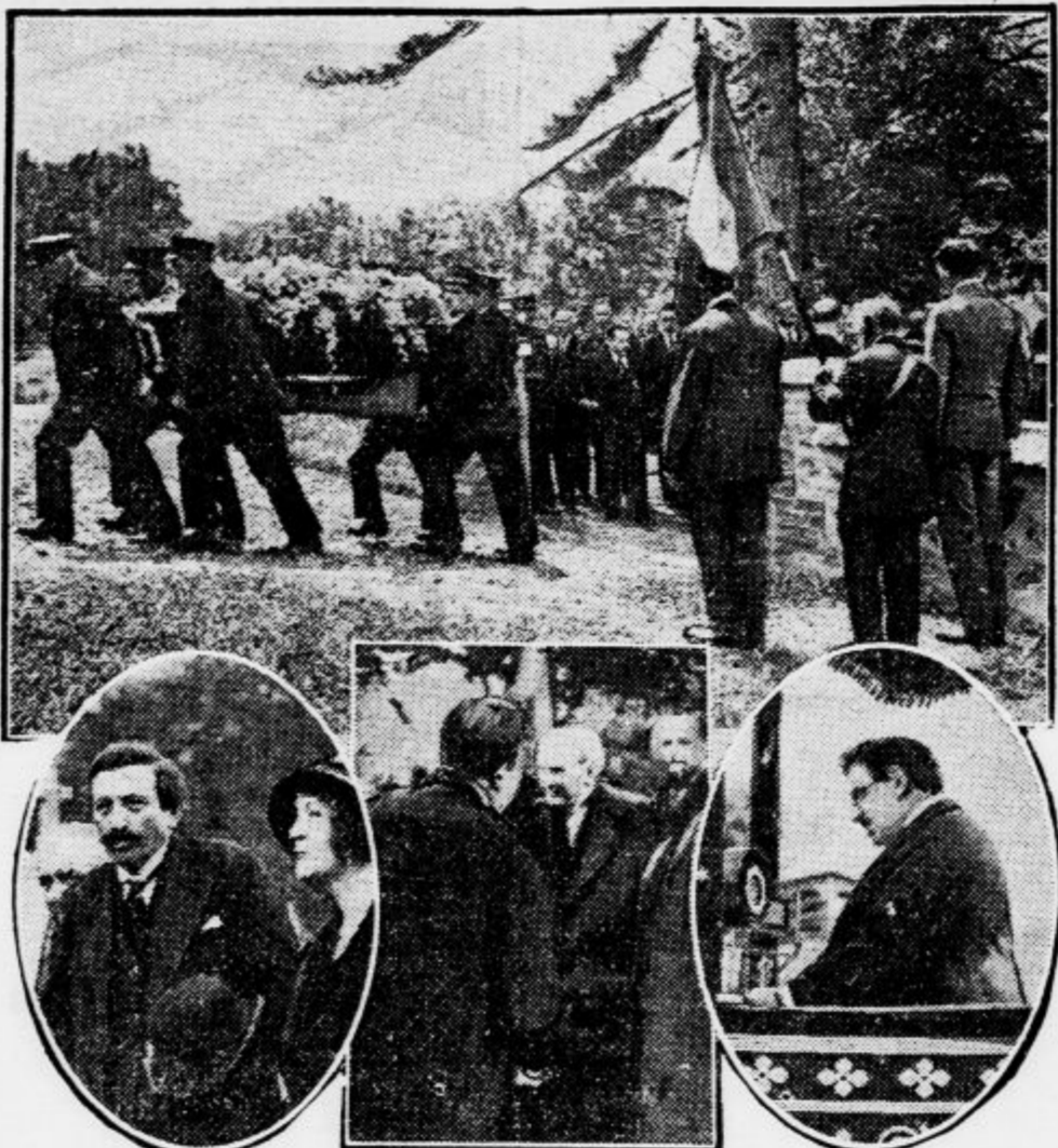
V nedeljo so prenesli iz Pariza zemeljske ostanke »apostola miru« v normandijsko vasico Cocherel, kjer je najrajši živel v svojih zadnjih letih. Slika kaže zgoraj prizor, ko je dospela krsta na cocherelsko pokopališče, spodaj na levi dva člana Briandove družine, v sredi Herriot in Kellogg na pokopališču, na desni govori ministrski predsednik svoj svečani govor