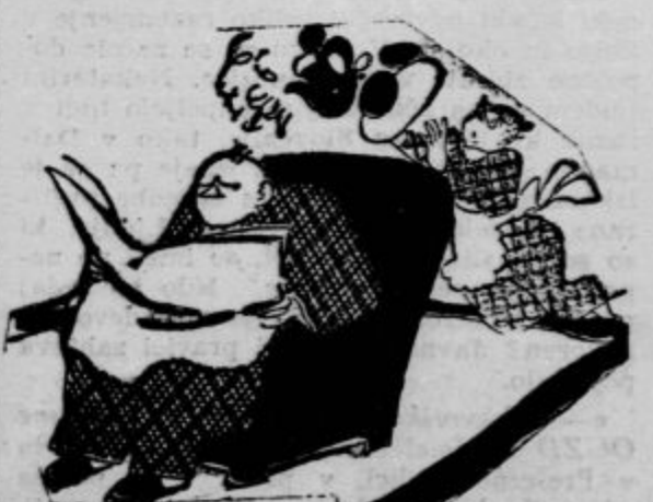
»Mici, pričakujem, da bo danes kava bolj vroča kakor včeraj...« (Tidens Tegn)