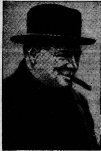
Winston Churchill, prvi lord admiraltete