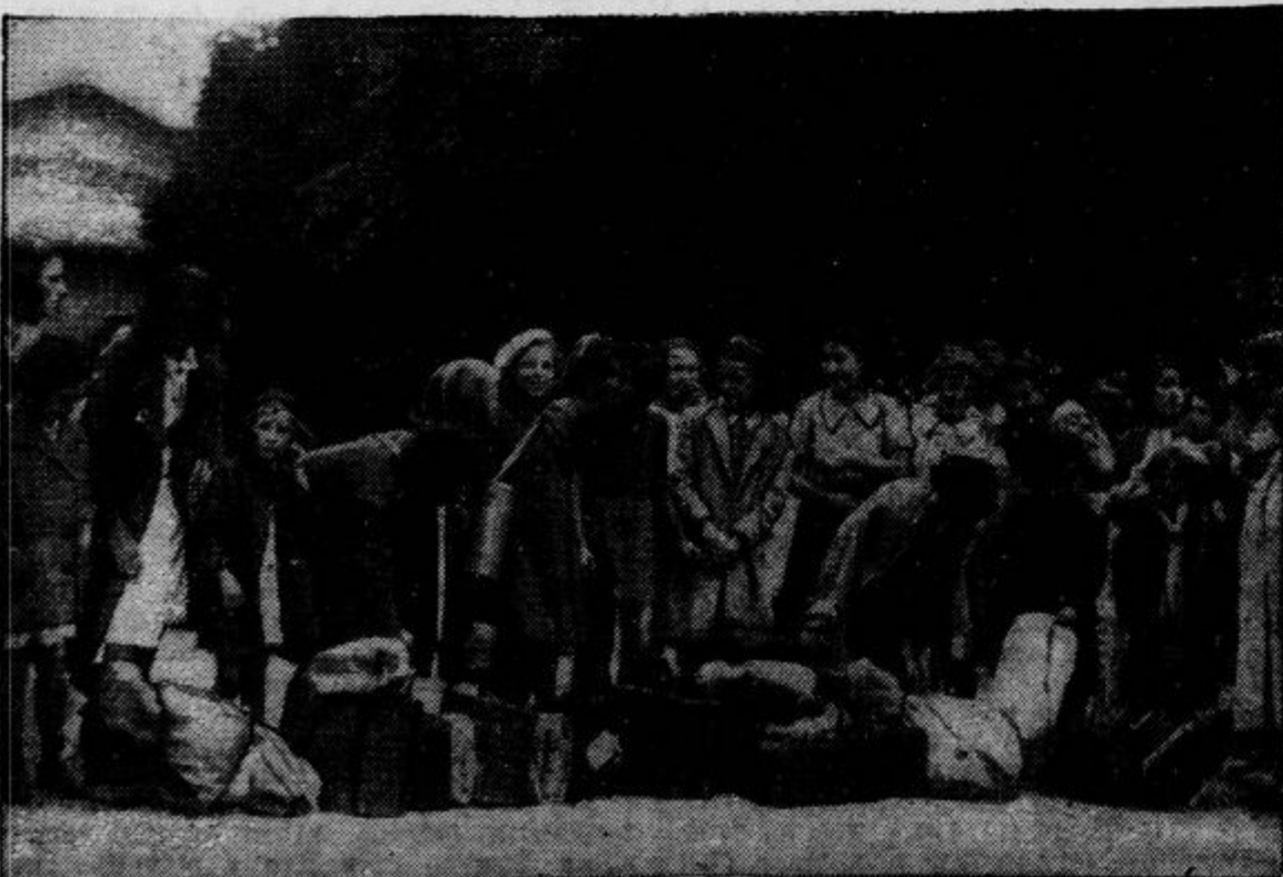
Pariški otroci v spremstvu roditeljev in sorodnikov pripravljeni na odhod iz prestolnice