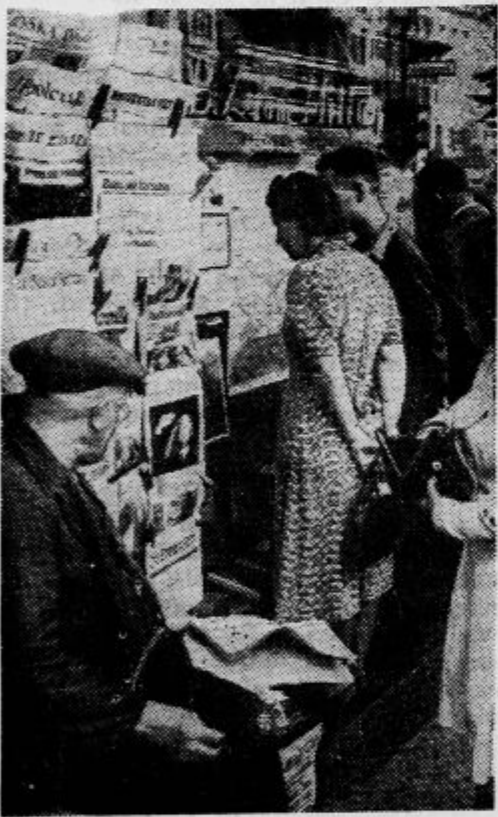
Pred berlinskimi kioski, kjer prodajajo liste, postajajo radovedni ljudje, ki jih zanimajo novice z bojišča