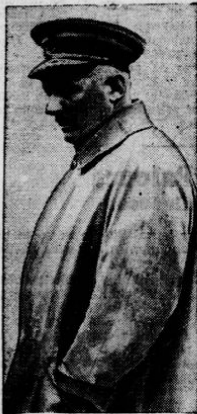
Sir Edmund Ironside