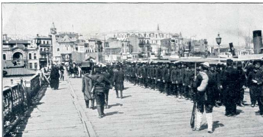
MLADOTURKI ŽENO VJETE SULTANOVE VOJAKE V ZAPOR

Sveta Terezija (str. 243) je najznačilnejši izmed pre mnogih kipov Berninija in njegove šole. Klasični slog Michel angelov jim je postal preveč enostaven, in ti epigoni velikih mojstrov so poizkušali doseči izredne efekte s posebnimi sredstvi. Sladkoba in senzitivnost v tem kipu kažeta, da je umetnik uprav iskal, kako bi potenciral čuvstvo. Ta inace krasni kip, ki ga umetniški zgodovinarji cenijo kot prvi