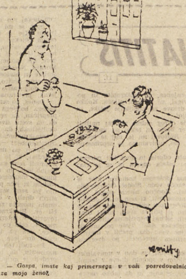
Gospa, imate kaj primernege v vaši posredovalnici za mojo ženo?