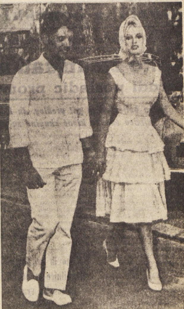
Brigitte Bardot se zadnje čase pogosto videva s kitaristom Sachom Distelom. Pravijo, da bi se iz tega znalo kaj roditi, baje celo poroka...

V San Giovanni so dosežaj našli trupla treh otrok truplo njihove matere ter se truplo 35 letne ženske in trupla dveh moških, za katere domnevajo, da so francoski turisti. Ker jim je voda odnesla obleko in druge predmete in ker se niso našli avto, ne morejo ugotoviti njihove identitete.