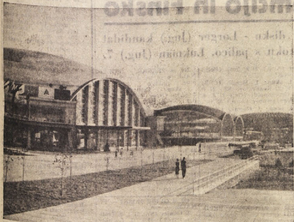
Pogled na del beogradskega sejmišča (I. II. in III. hala)

Lani za 400 milijard pogodb, za koliko jih bo letos?