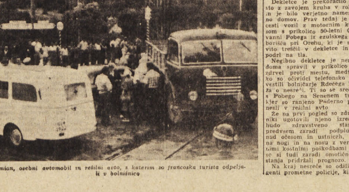
Kamion, osebni avtomobil in rešilni avto, s katerim so francoski turisti odpeljali v bolnišnico