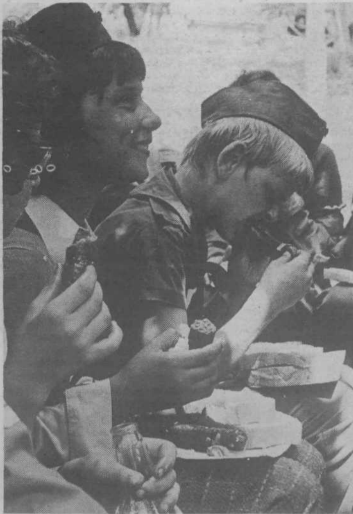
Malo se oddahnemo potem pa spet na pot