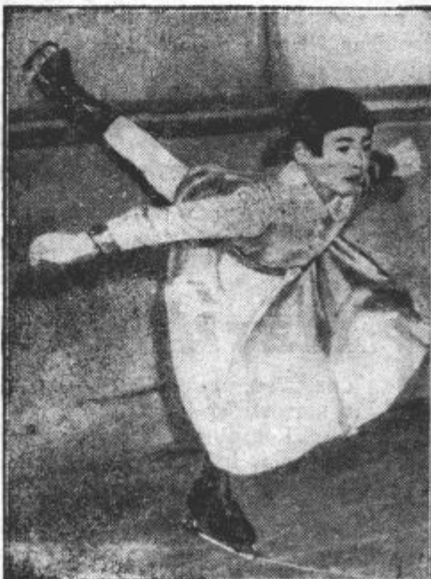
V spretnosti umetnega drsanja je ta dekle na Japonskem najboljša