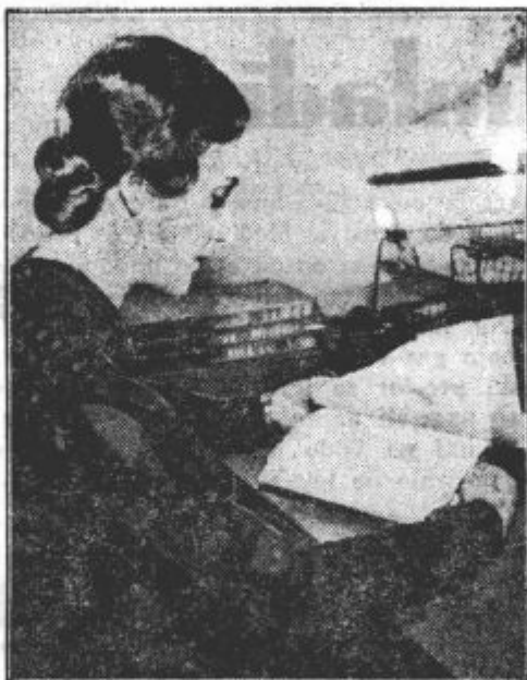
Tajnica predsednika Združenih držav (USA) Alojzija Wilson

Obležala je mrtva z razbito glavo. Njena želja, da bi umrla, se je na tako grozen način uresničila.