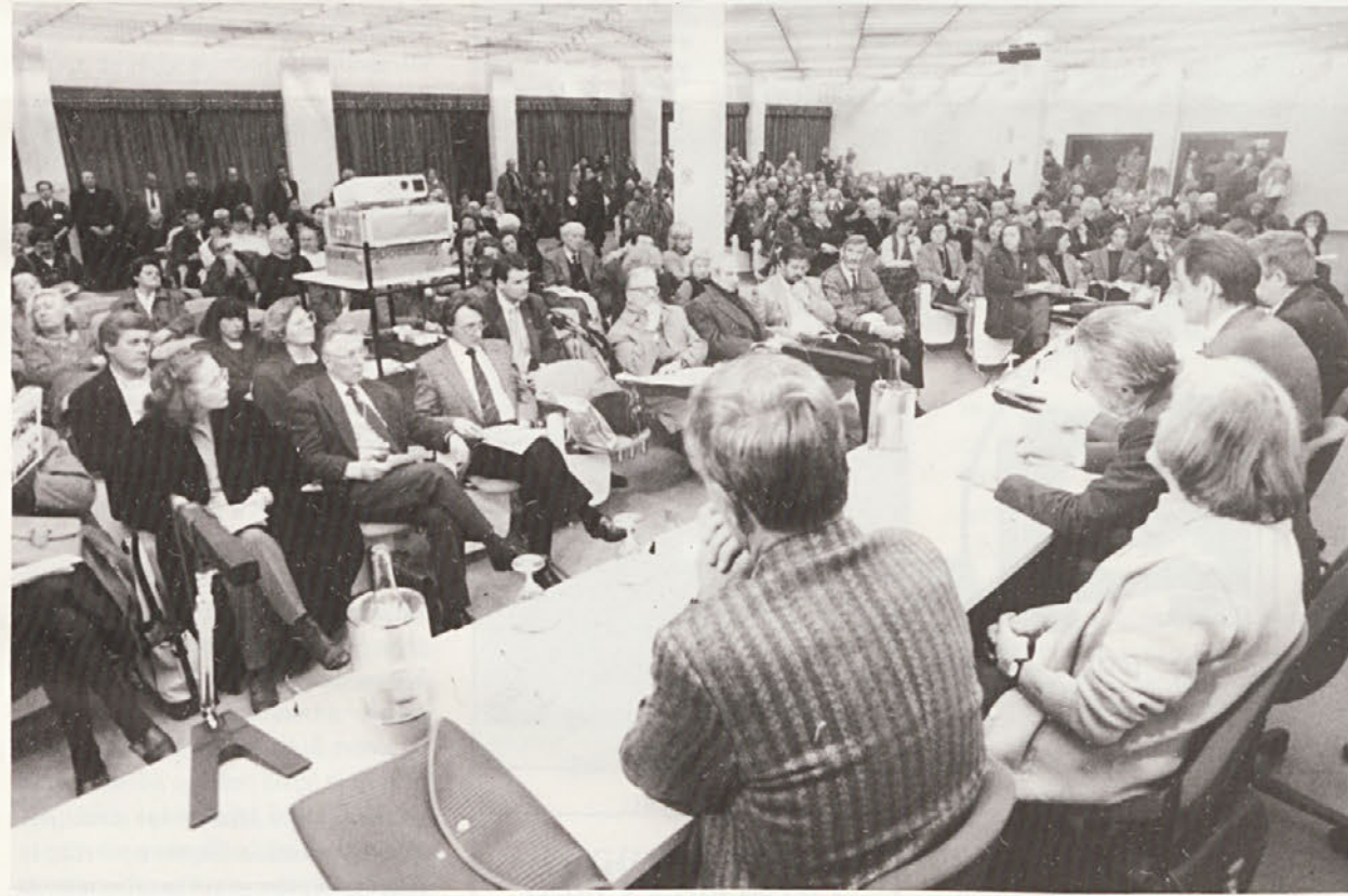
Pogled na nabito polno dvorano na Pomorski postaji, ko je na skupščini Demokratična zveza odločila, da se na volitvah predstavi s simbolom DSL.