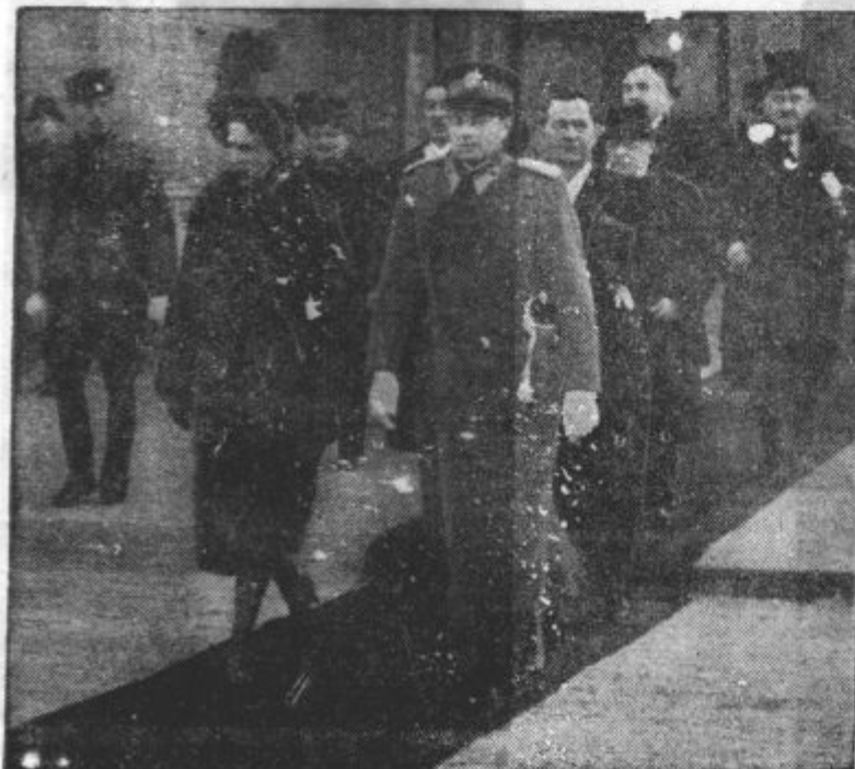
Po odličnih gostov iz cerkve v banske dvore