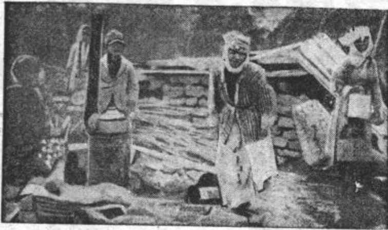
Prebivalci, ki jim je potres vzel streho, se grejejo ob pečici na prostem

Opustošenje po strašnem potresu v Turčiji nam kažejo prvi posnetki iz Erzingnana