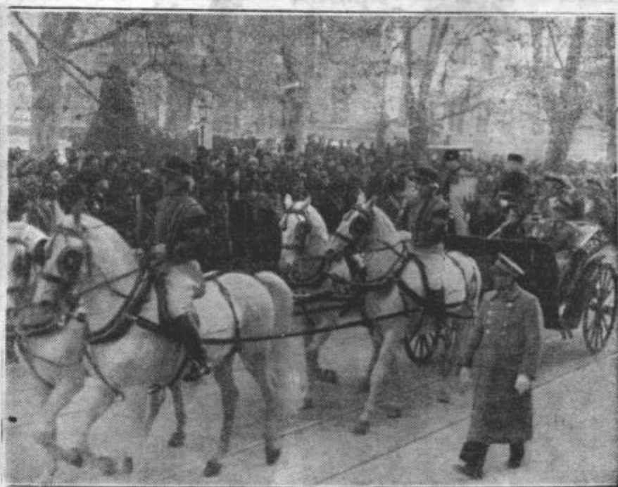
Vožnja čez Zrinjevac v mesto s postaja