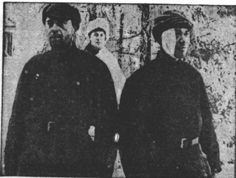
DVA UJETA RUSA. Finski vojaki so ujeli dva vojaka rdeče vojske. Ta posnetek roma sdaj širou sveta