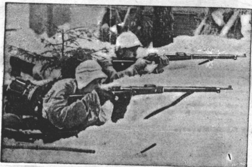
FINSKI STRELCI V BORBI. Posnetek s severnega bojišča pri Pečengi