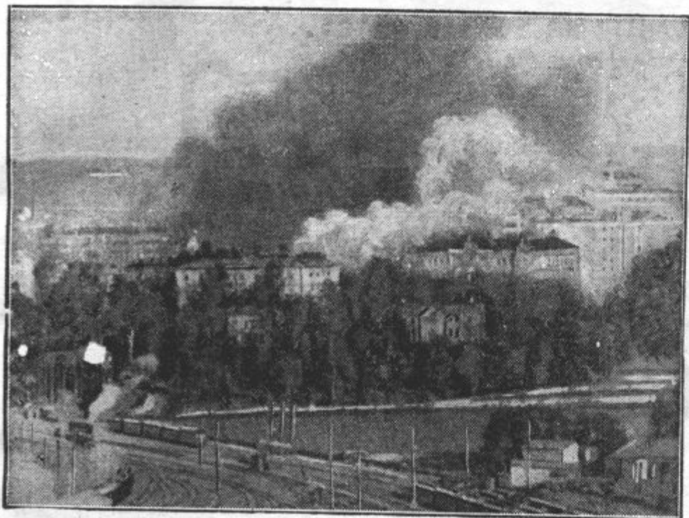
VIBORG , pristaniško mesto na Finskem, o priliki napada sovjetskih bombnikov