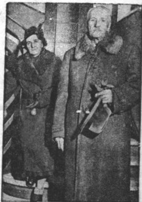
MOSCICKI V SVICI. Odstopivši prezident Poljske Ignac Moscicki se je pripeljal na zdravljenje v Švico. Fotograf ga je posnel v družbi njegove soproge pri odhodu iz hotela v Fribourgu