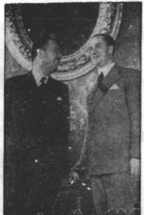
SESTANEK V BENETKAH. Madžarski sun. minister grof Csaky in njegov italijanski tovariš grof Ciano na sestanku v Benetkah