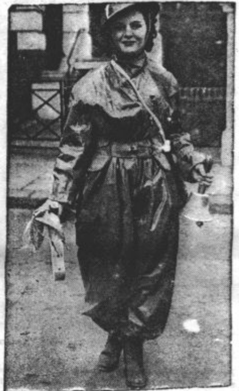
ANGLESKA OBRAMBA. V Londonu imajo izborna obrambo proti napadom iz zraka. Ta ženska, ki pripada zaščitnim oddelkom, drži v eni roki zvonec, v drugi plinsko masko, na glavi pa nosi jeklene čelado