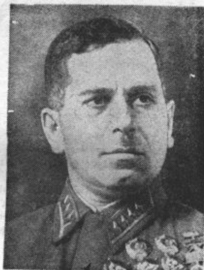
GENERAL STERN. Na finskem bojišču je sovjetska vlada v Moskvi poverila s poveljstvom generala Sterna, ki se je svojčas izkazal na Daljnem vzhodu