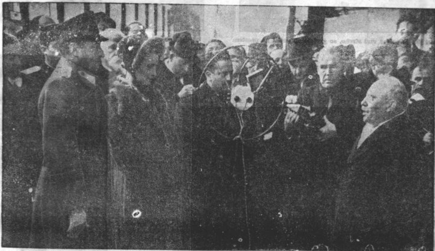
Dr. Maček pozdravlja na zagrebškem kolodvoru kneza namestnika in kneginjo Olgo pri njenem prihodu v Zagreb