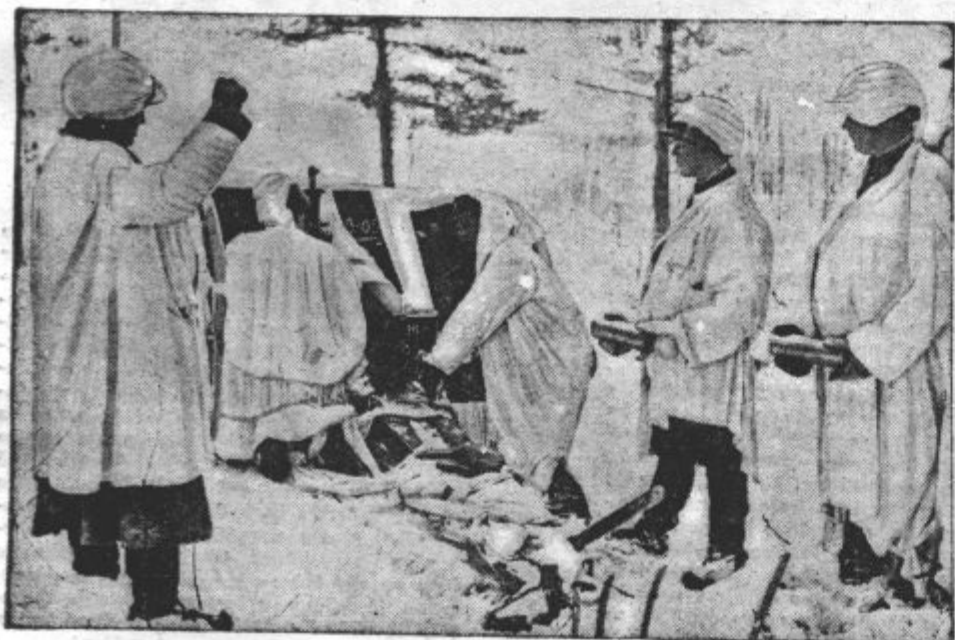
FINSKI TOPNICARJI nosijo v snegu bele plašče, ki jih delajo nevidne v snegu