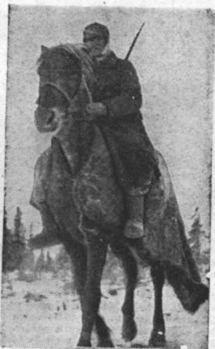
FINEC NA KONJU. Finski vojaški jezdec s bojišča pri Salli, kjer vlada takšen mraz, da morajo biti tudi živali pokrite s toplimi kožuhovinastimi odejami